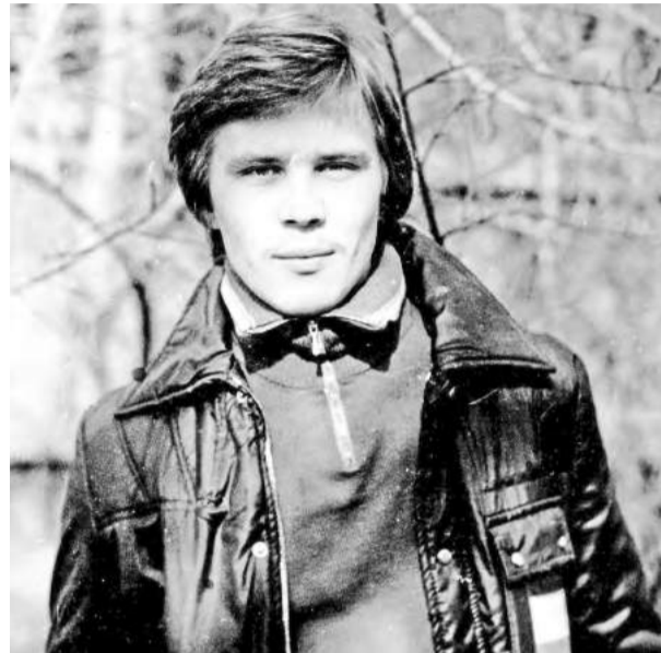
Молодость - 1979