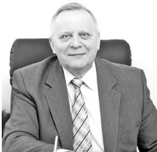
Зрелость - 2023

- Брата, которого отродясь не было, до сих пор вспоминают мои одноклассники, с которыми ел кашу в садике, - удивляется давно повзрослевший Скитович способностям своих свер-