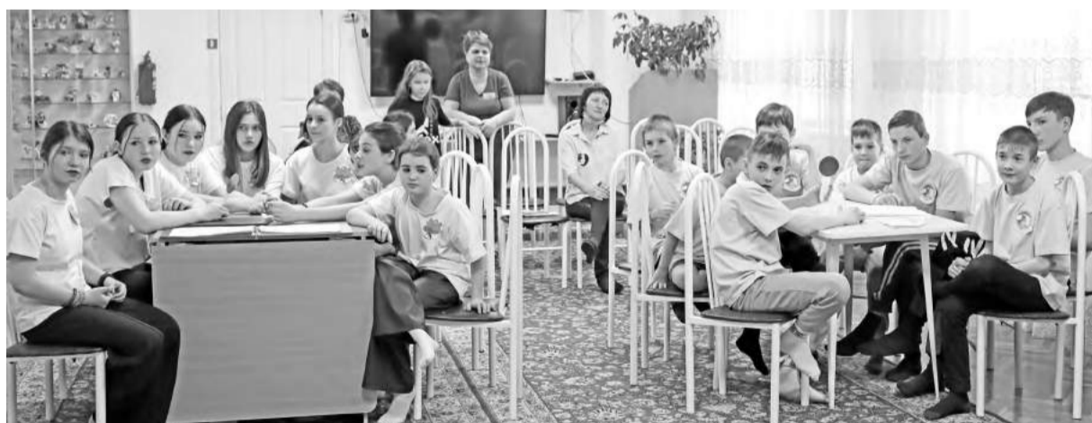
Познавательная игра по истории и культуре нашей республики

Второй раунд «По заповедным тропам родного края» выявил, насколько хорошо ребята знакомы с достопримечательностями Хакасии. Участники игры вспомнили год образования республики, сколько городов и районов в Хакасии; в жарких спорах выяснили, что