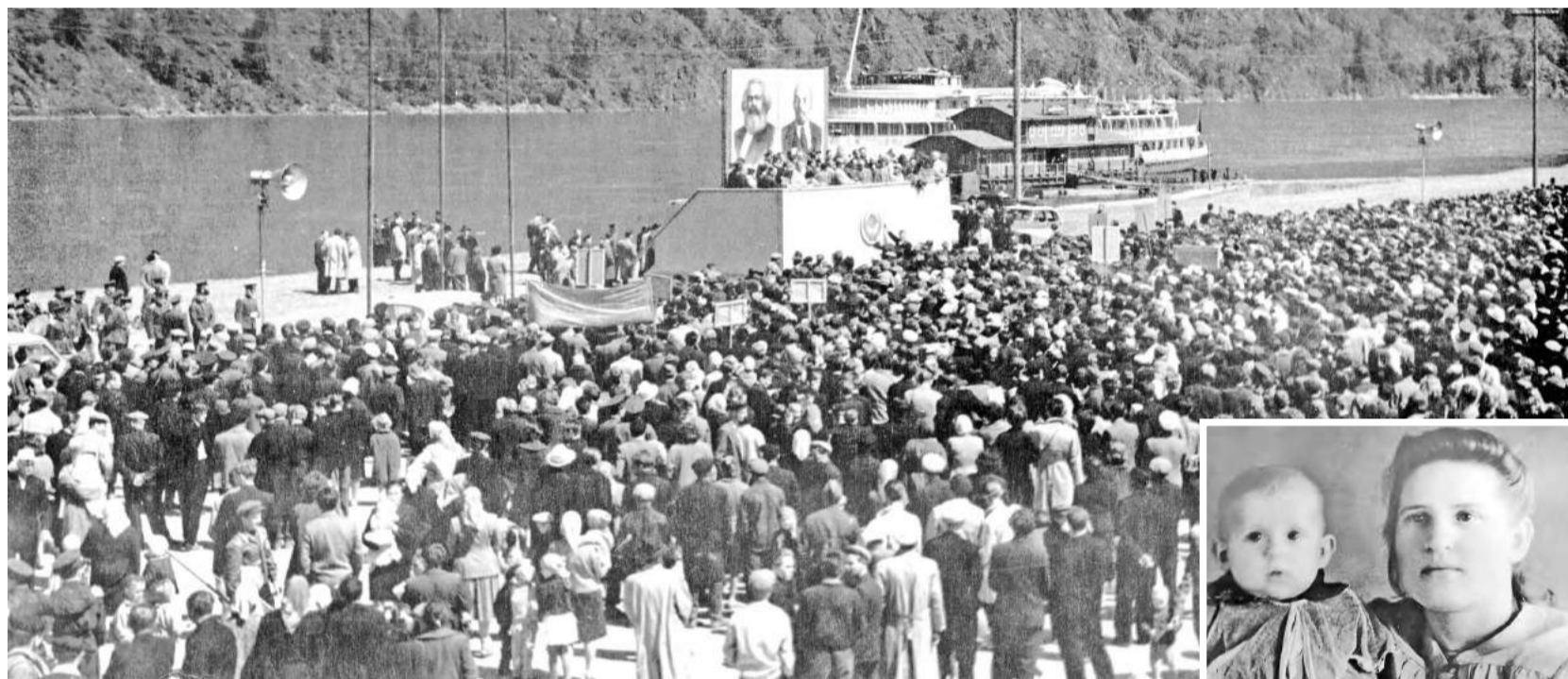
Встреча Вальтера Ульбрихта на Красноярской ГЭС, 7 июня 1964 г.

чину» - на работы в Германию. Тотальное истребление привело к тому, что крестьяне стали уходить в лес. Карательные отряды постоянно прочёсывали леса и болота. Если кого-то вылавливали - пытали, а затем расстреливали или вешали. Леса обстреливали артиллерией, бомбили с самолётов.