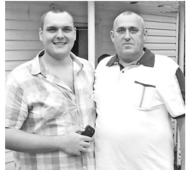
Сын и отец плечом к плечу