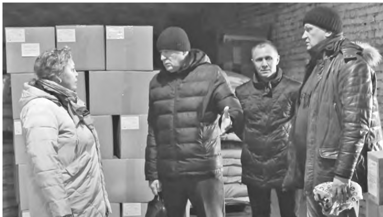
Предметный разговор за полчаса до отправки фуры «за ленточку»

- Представить только: нашим землякам в зону СВО отправлено 25 тонн гуманитарного груза! - знает, о чём говорит, руководитель городского КСВО. - Макароны, изделия, крупы, тушёнка, сгущённое молоко,