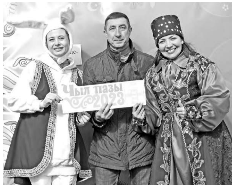
Здравствуй, праздник Солнца и Весны!

Нина БОГАТЫРЁВА