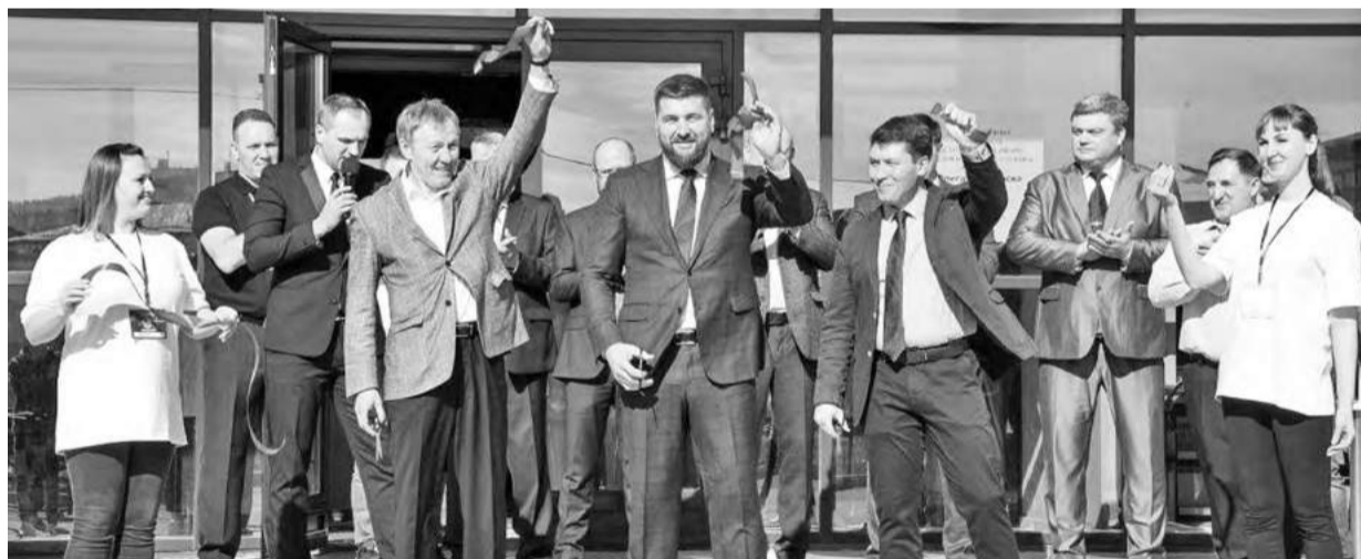
Даём отмашку на старт!

спортсменов, и всех любителей. Более того, оснащённые качественным оборудованием залы, помимо повседневных тренировок, смогут принимать турниры различного уровня.