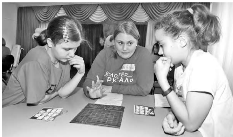
Вместе проще учиться и выполнять задания

какой путь выбрать в реальной жизни. Затем состоялась игра «Это вообще законно?», где волонтеры вместе с ребятами