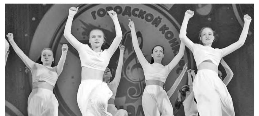
Саяногорские «звёздочки» взлетели высоко

Кроме того, целую россыпь наград вручили десяткам других номинантов: дипломами I степени отмечено 19 творческих номеров, дипломами II степени - 20 номеров, дипломами III степени - 21 номер. Остальные конкурсанты получили дипломы участников фестиваля.