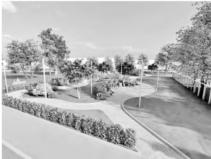
Так будут выглядеть общественные территории в районе школы искусств «Акварель» и школы № 1

В посёлке Майна благоустроят две общественные территории. Так, в районе