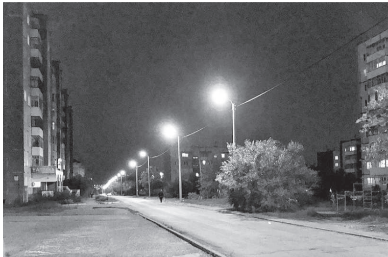
Ярко светят фонари в Центральном микрорайоне

- Нет, конечно. Мы ищем и находим партнёров, чтобы ежегодно вводить новые энергетические мощности. Например, вместе с Хакасэнерго смонтировали уличное освещение на улице Мечты на Ай-Дае. Сейчас улица полностью освещена. Были произведены работы на улицах Ветеранов труда,