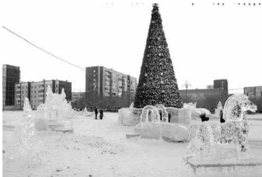
Ледовый городок

Мероприятия по случаю открытия новогодней ёлки пройдут в Черёмушках 21 декабря, в Саяногорске ёлка откроется 24 декабря, 26-го - в Богословке, а 28-го - в Майне. Для одарённых детей и ребят, находящихся под особой защитой государства, пройдут ёлки мэра, для которых артисты Дворца культуры «Визит» подготовили четыре новогодних пред-