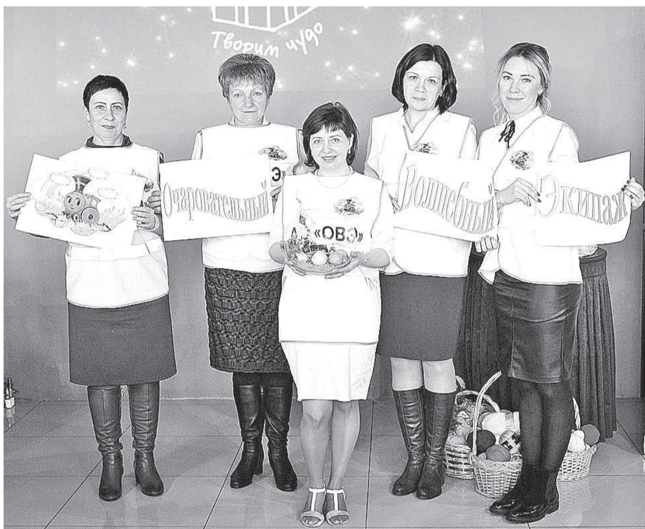
Команда ОВЭ «Экипаж» впервые участвует в новогоднем марафоне

В Саяногорске стартовал VII традиционный новогодний благотворительный марафон РУСАЛа «Верим в чудо, творим чудо!». Нынче число команд, решивших запустить эстафету добрых дел, достигло девяти.