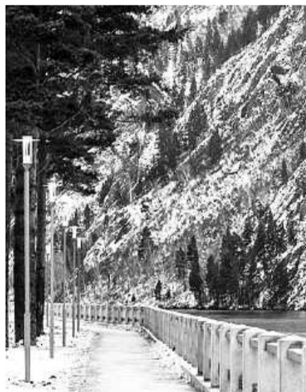
Набережная в Черёмушках