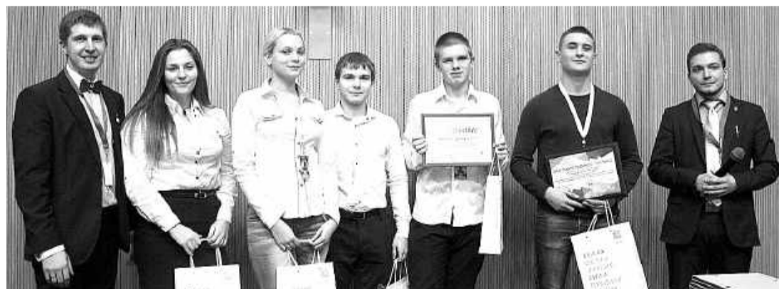
Церемония награждения команды СПТ в Санкт-Петербурге

Третий год подряд в стенах техникума проводится региональный отборочный этап среди студенческих команд. И всегда активными участниками являются специалисты компании, которые проводят экспертизу выполненных заданий на профессиональном уровне. Наиболее перспективных студентов приглашают на стажировку на предприятия компании. РУСАЛ оказывает финансовую поддержку в поездке команды победителей на молодёжный межрегиональный форум ТИМ «Бирюса», где ребята получают новые знания во время прак-