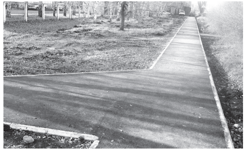
Результат реализации программы (ноябрь 2017 года)