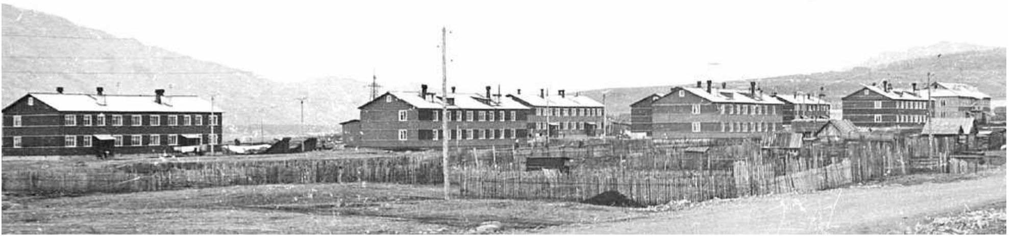
Посёлок Означенное. Начало 60-х годов.