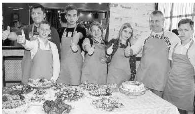
Заключительный поединок, объединивший всех участников проекта «Кулинарные премудрости»