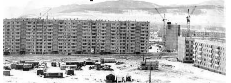
Десант строителей на месте будущего дома № 2 в Советском микрорайоне

Размещение Саянского алюминиевого завода в Бейском районе поставило задачу превращения рабочего посёлка Означенное в город областного подчинения. В 1975 году это решение было принято.