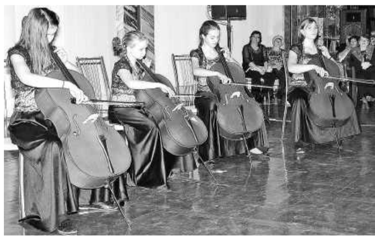
В вихре музыки

Однажды Министерство культуры Хакасии предложило нам провести фестиваль на конкурсной основе, с жюри и артистами со всей республики,