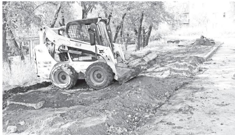
Создание в рамках программы пешеходных дорожек и автомобильной парковки возле здания УСПН (август 2017 года)

В ежегодном Послании Федеральному Собранию Российской Федерации Президент Владимир Путин объявил: в 2017 году Правительством РФ будут выделены немалые средства на реализацию проекта «Формирование комфортной городской среды», инициированного партией «Единая Россия». Сегодня масштабная инициатива запущена по всей стране. Как она работает в МО г. Саяногорск, корреспондент «СВ» узнал у Главы муниципалитета Леонида БЫКОВА.