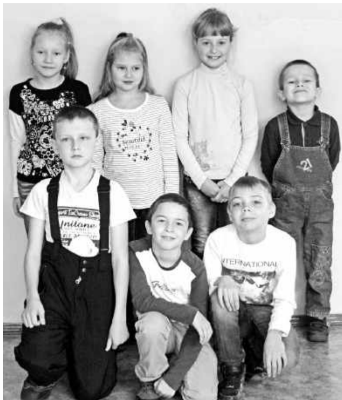
Саяногорская плеяда юных талантов