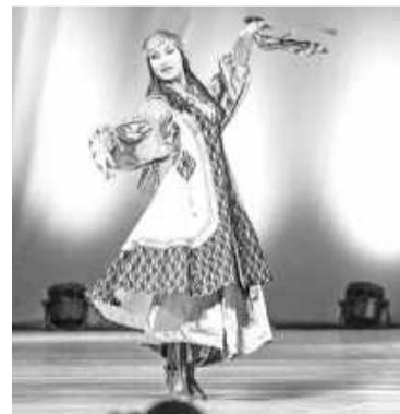
Изящными движениями танцовщица передаёт красоту окружающего мира

Уникальные коллективы покорили французские Канны во время Фестиваля российского искусства и достойно представили удивительную культуру Хакасии. Им ни единожды руко-