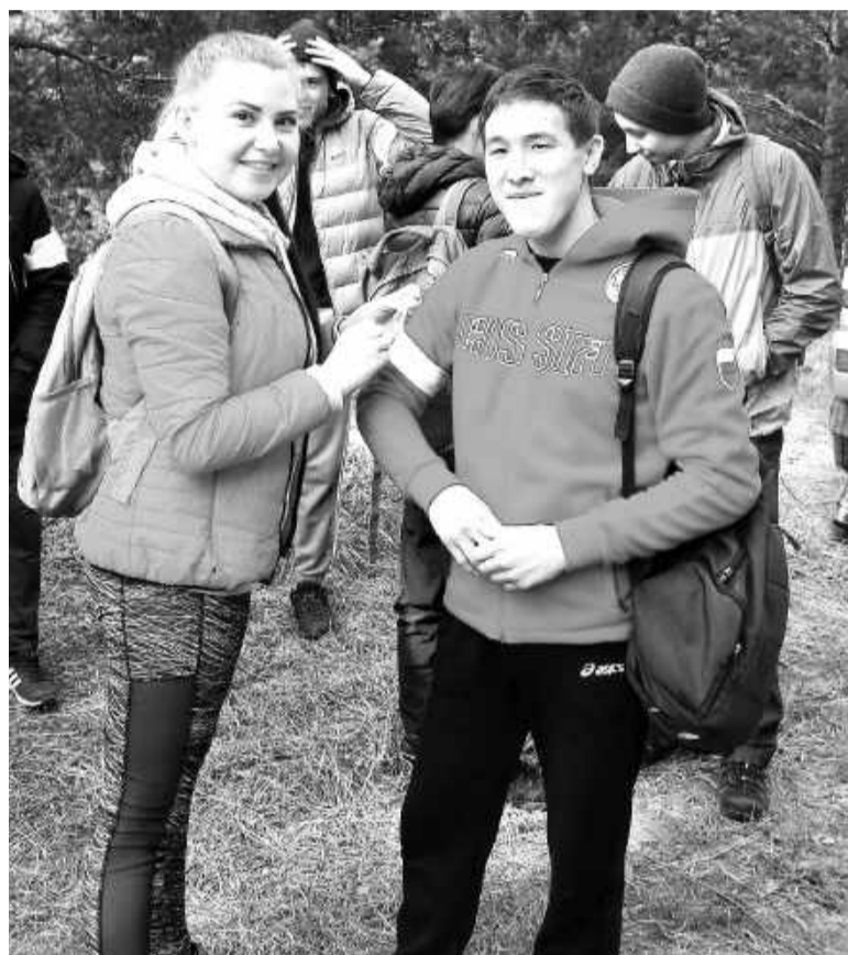
Волонтером быть круто!

С 2012 года в Хакасии стало традицией осеннее благоустройство лесов