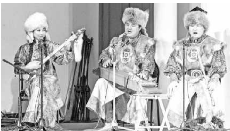
Музыканты ведут кропотливую работу по восстановлению почти забытых хакасских мелодий, песен, тахпахов и возрождают игру на национальных инструментах

Ансамбль «Үлгер» появился в 1989 году. С той поры он активно пропагандирует традиционную хакасскую музыкальную культуру.