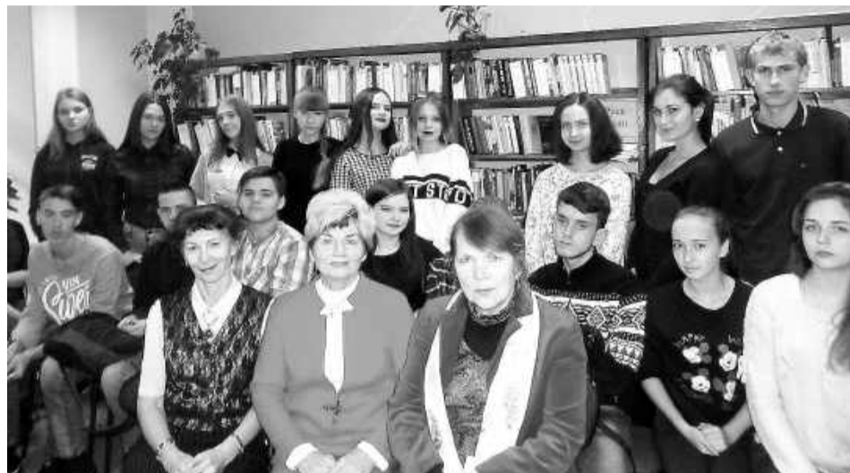
На одной литературной волне

Радует, что многие девушки и юноши знают и ценят поэзию: у кого-то дома есть сборники авторов объединения «Стрежень», кто-то сам пишет стихи о любви, природе и уже публиковался.