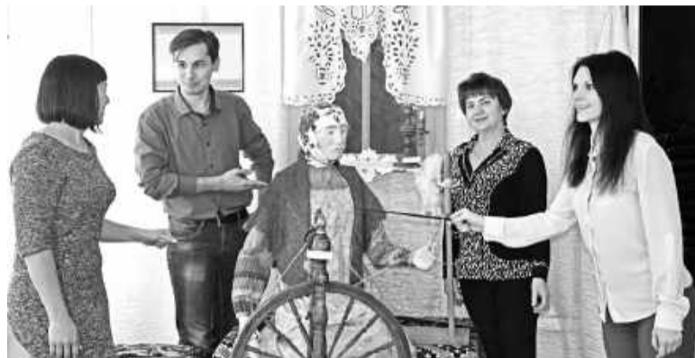
И сидит за прялкой пряха...

А теперь немного окунёмся в историю создания прялки. Некогда без неё невозможно было представить ни один дом, ни одну девочку, девушку и женщину. Нынешняя молодёжь может не знать, что такое прялка вообще. Про то, как она выглядела и каким образом работала - спрашивать даже не стоит. Но учитывая, какое место в жизни людей занимало это устройство раньше, нельзя забывать об этом, когда-то просто необходимом инструменте. Многие ли знают, что одно из первых изобретений принадлежит Леонардо да Винчи? Примерно в 1490 году