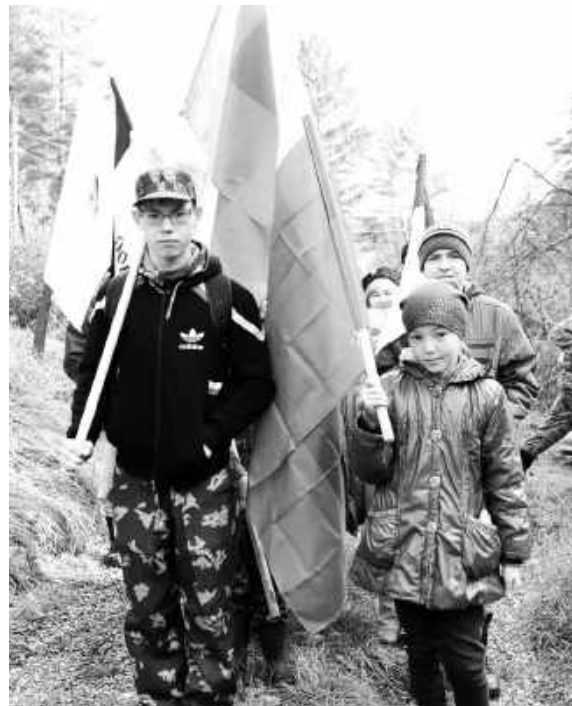
В историческую экспедицию, как полагается, - с государственными флагами

Пограничный столб времён освоения казаками долины реки Енисей стал поводом для интереснейшего похода