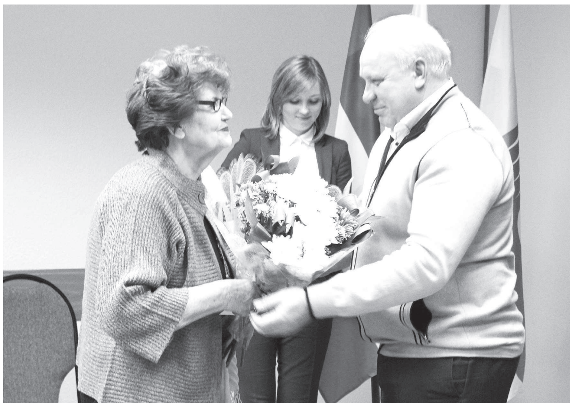
Высокое признание высоких заслуг

Воспоминания о школьных годах - это учёба, чтение и рабо-