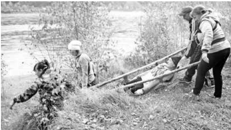
Своих в беде не бросаем