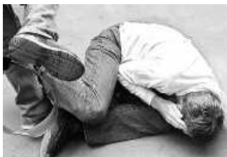
ной забрюшинной гематомы.

Смерть потерпевшего наступила на месте происшествия в результате переломов рёбер, разрывов почек с развитием массив-