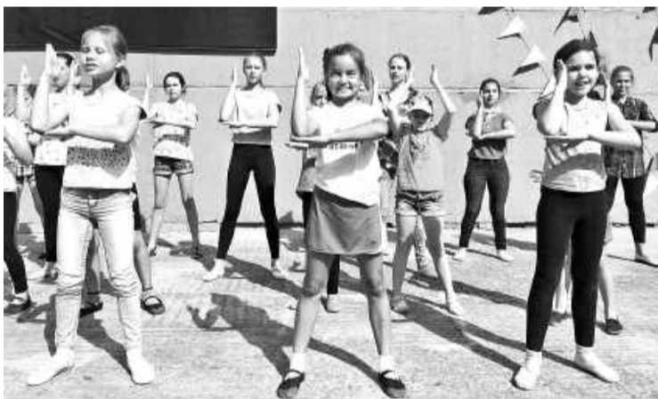
Озорные улыбки подрастающего поколения, их успехи и начинания - главный подарок всем педагогам к Дню учителя

Всево в лицее четыре направления: два вышеназванных, а также экономическое и биохимическое. Универсальными в школе являются только начальные классы, начиная с пятого - формируется предпрофильная подготовка, а к седьмому