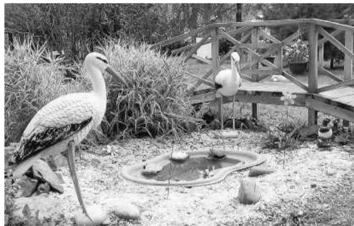
Сказочные герои встречают воспитанников детского сада «Фонарик»

Задорные песни, стихи и танцы в исполнении детей и воспитателей стали настоящим украшением праздника. Но самое интересное было