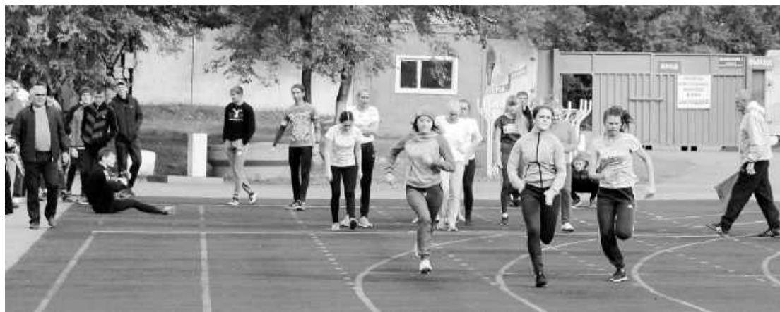
Красота среди бегущих: первых нет и отстающих

Городской фестиваль состоялся в два этапа. Молодые люди ставили свои рекорды в беге, прыжках,