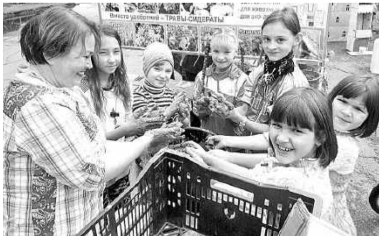
Слепим шарик вшестером и очистим водоём!

В атмосферу фестиваля погрузились все желающие, без ограничений по возрасту. На выбор участникам предложили несколько зон - тактильный зоопарк, раскрашивание домиков, игровую и историческую зоны, лепку шариков из глины, в которую добавлено специальное эко-вещество, способное очищать целые водоёмы. По задумке организаторов, шарики отправятся на дно «лягушатника» в зоне отдыха Енисейского микрорайона, чтобы освободить его от грязи. А мы с дочками заранее нарисовали картинки на тему «Зелёная планета» и изготовили поделку - большой вязаный горох с забавной гусеницей внутри. Девчонки работы заняли достойное место на выставке, организованной здесь же, на улице.