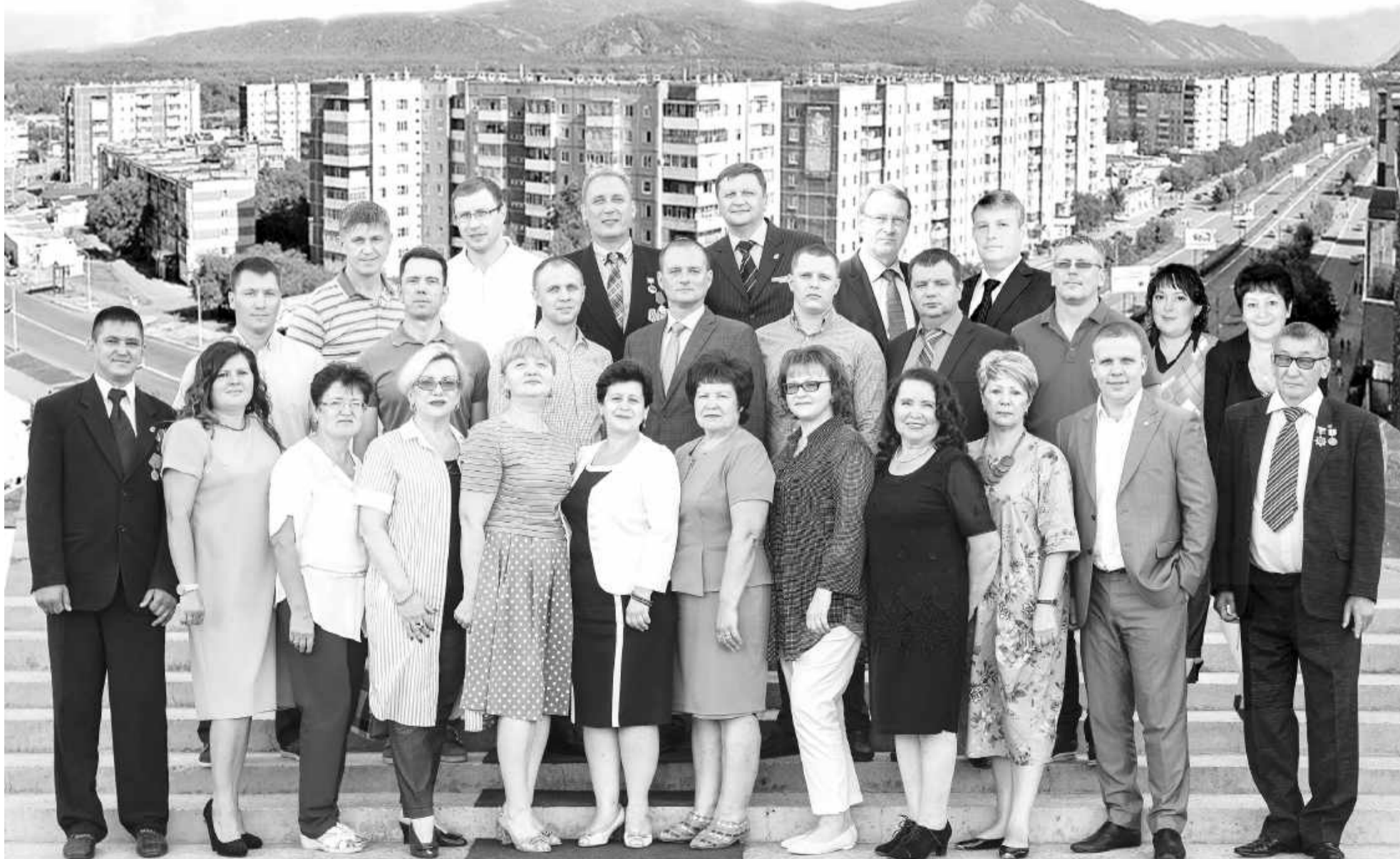
Оплачено из средств избирательного фонда Саяногорского местного отделения Хакасского регионального отделения Всероссийской политической партии «ЕДИНАЯ РОССИЯ»

Мы все разные, объединил нас Саяногорск!