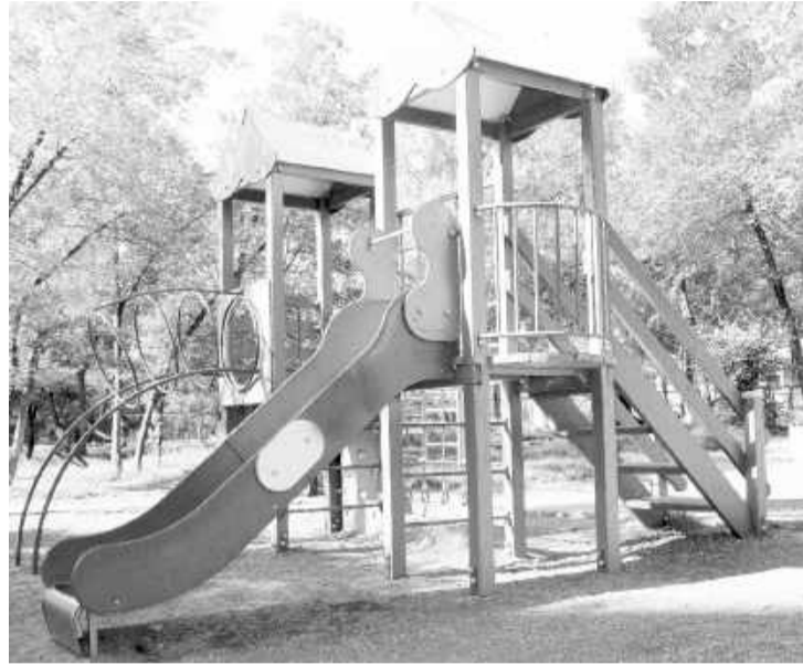
Игровой комплекс у дома № 9 в Советском микрорайоне