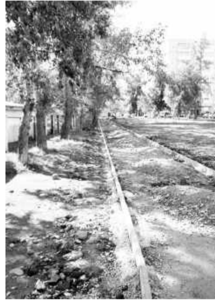
Будет новый тротуар во дворе дома № 41 в Заводском микрорайоне

Со следующего года программа «Формирование комфортной городской среды» продолжится, но несколько в ином формате: она будет носить не заявительный характер, а инвентаризационный. И первые шаги в этом направлении делаются уже сегодня - дворовые территории обзаводятся особыми паспортами, в которых отмечаются все особенности двора.