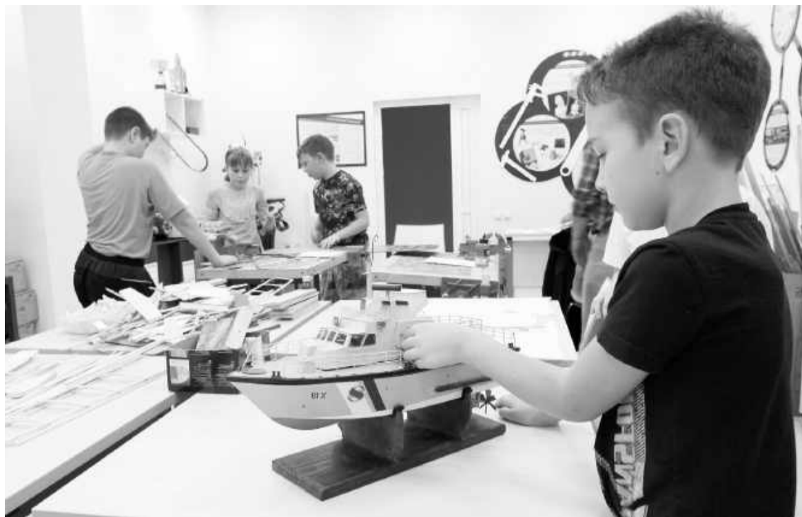
На занятии в кружке моделирования в УПИИЦ