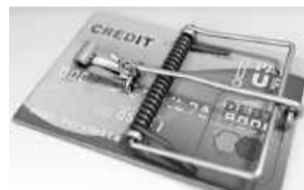
суете женщина подмахнула их, а когда пришла домой и внимательно ознакомилась с содержанием, выяснила, что подписала кредитный дого-

«Счастливой обладательнице» купона дали подписать какие-то бумаги. В