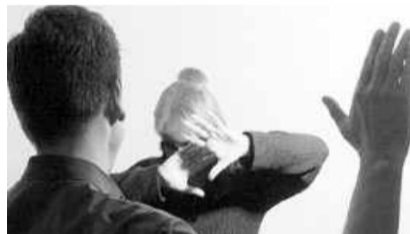
бес волен. Мужчина схватил трубку от пылесоса и нанёс несколько

Мало того, что сыночек не работает, так ещё и злоупотребляет спиртными напитками. Придя домой после очередного загула, он поссорился с матерью. Как говорится, в пьяном