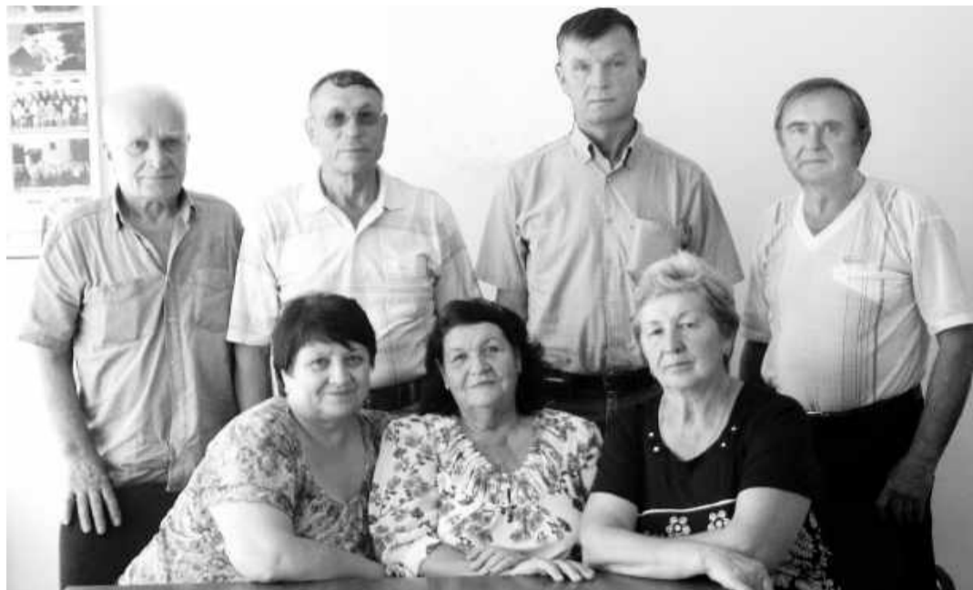
Встреча старых друзей

материалы с домостроительного комбината из Саяногорска (тогда ещё Означенного) по объектам в Черёмушках, Майне и Саяногорске. Для обеспечения продуктами питания строителей было задействовано 50 машин, возили, в основном, из Абакана.