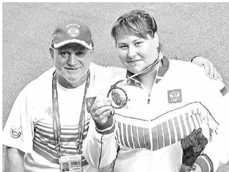
Полюбуйтесь тандемом - тренер и чемпионка

- А вы хоть знаете, кто это? - ехидно задаю вопрос и замечаю изумление в глазах продавца. - Перед вами, между прочим, трёхкратная чемпионка мира по борьбе на поясах!