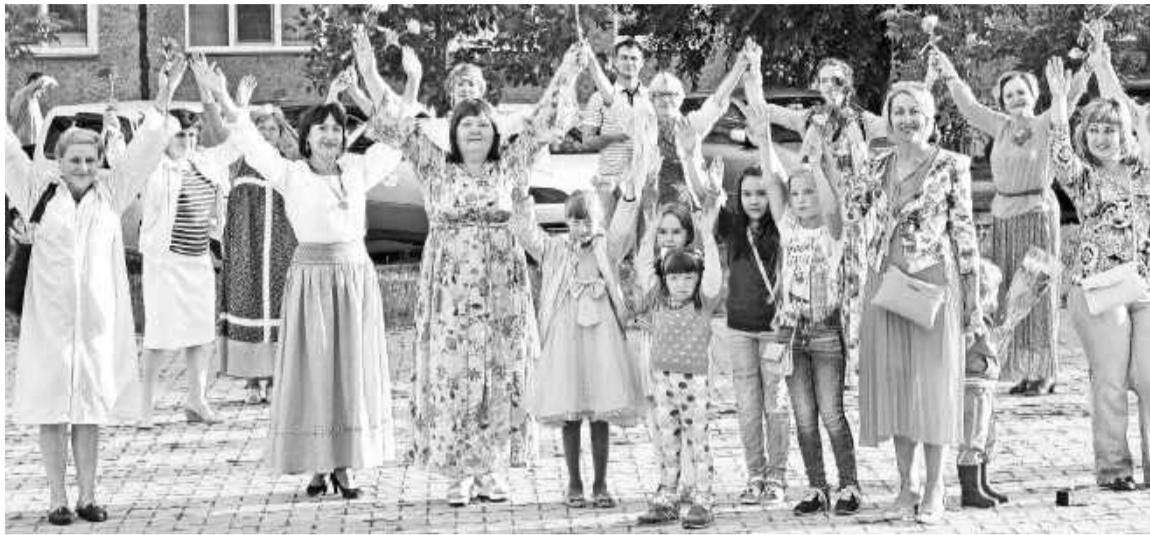
Женщина - небесное создание. Облако несбыточных желаний.

Идея проведения необычного флешмоба в Саяногорске принадлежит представительнице славяноведического