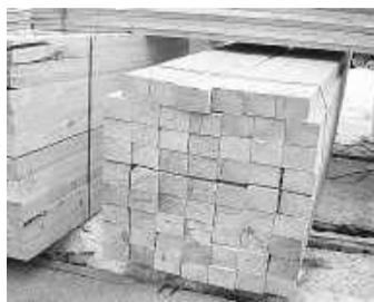
ревила на карту продавца указанную сумму, но бруса

Одним из условий сделки стала предоплата, однако это не насторожило покупательницу. Она пе-