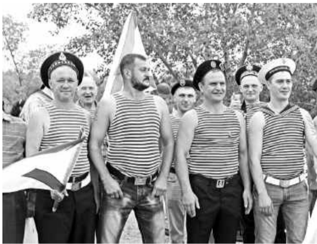
Душу греет полосатая тельняшка