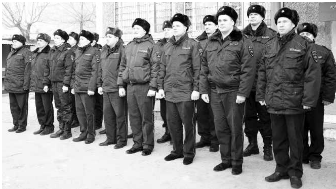
Оперативный взвод заступает на охрану порядка

лись обходные посты и патрулирование на мотоциклах. Постепенно милицмейские наряды вытеснили сторожей.