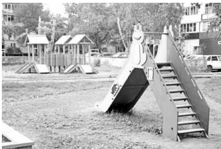
Всё для детей во дворе дома № 40 Советского м-на

Затем в течение месяца отбирали наиболее актуальные проекты из всей внушительной массы предложений: 129 заявок было подано горожанами по благоустройству дворовых территорий и 24 - по преобразованию общественных мест. В итоге после проверки заявок на соответствие необходимым критериям на одном из заседаний комиссии отобрали 39 проектов, касающихся дворов, и 17, направленных на