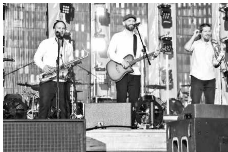
«UMA2RMAN» подарила незабываемые хиты