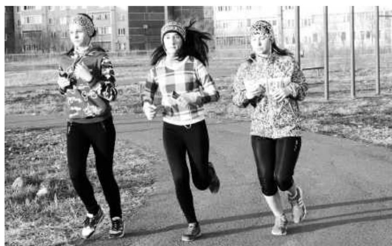
Выполнение нормативов ГТО среди школьников в парке активного отдыха