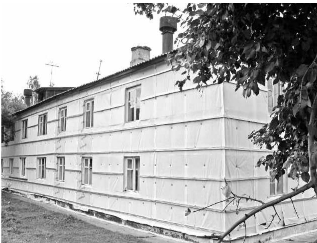
Дома такого плана подпадают под программу капитального ремонта