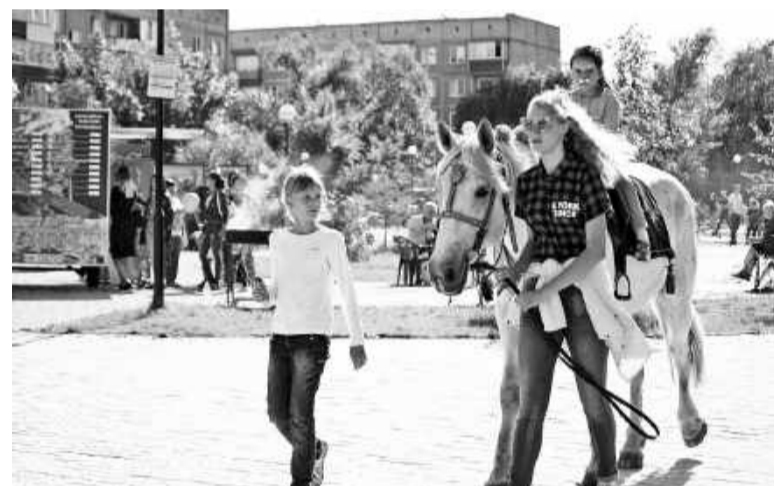
Белая лошадка так послушна!