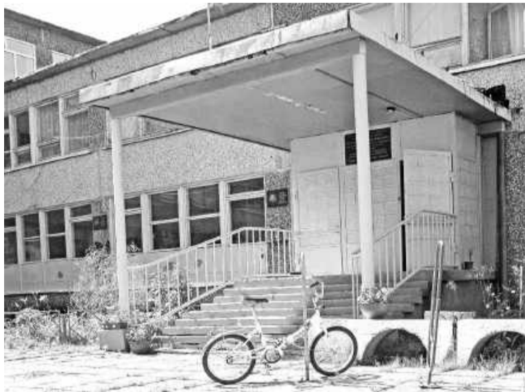
Спортивную школу ждут перемены