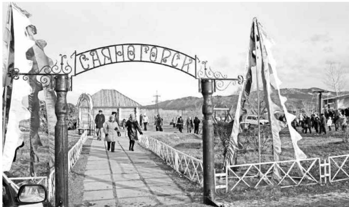
Открытие этнокультурного комплекса «Ымай», 2016 год

Продолжится реализация проекта «Ымай - центр трёх культур» - победителя 2015 года. Уже сегодня мы видим, что на месте бывшего пустыря на Амыльской набережной расположен этнокультурный комплекс, который привлекает внимание саяногорцев и гостей города. Вскоре здесь появится ещё множество объектов