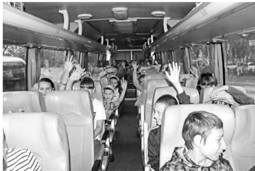
Увидимся через три недели!

Все вместе провожаем детей до автобусов, мамы, папы волнуются, ещё раз всё проверяют, целуют, обнимают своих деток. Прощаемся, делаем фото на память - и отпускаем довольных-предовольных ребятшек. В путь!