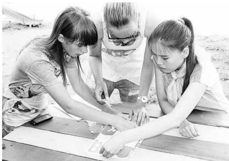
Команда «Светофор» изучает маршрутный лист

станциях мальчишкам и девчонкам предстояло пройти ряд испытаний: ответить на вопросы по правилам дорожного движения для пешеходов, велосипедистов, пассажиров легкового и пассажирского транспорта; собрать пазлы «знаки дорожного движения»; вспомнить, как необходимо вести себя пешеходам и водителям при переходе и проезде перекрестков на различные сигналы светофора и даже проявить свои знания по оказанию первой медицинской помощи и перечислить первичные средства пожаротушения. На станции «Спортивная» команды соревновались на самый длинный командный прыжок, строили пешеходный переход, выявляли самую меткую команду. На станции «Музыкальная» пели частушки и песни, посвященные пожарной безопасности. На станции «Эрудит» отгадывали загадки о дорожных знаках и выбирали картинки с изображением правильных ответов. С двумя штрафными баллами первыми прибежали к спрятанному фрагменту карты мальчишки из команды «Зебра», с трудом, но всё-таки обнаружив его. Девочки из команды «Светофор» безошибочно выполнили все задания. В итоге победила дружба! Но главное - дети получили много положительных эмоций, пополнили свой багаж знаний и пообещали соблюдать правила пожарной и дорожной безопасности.