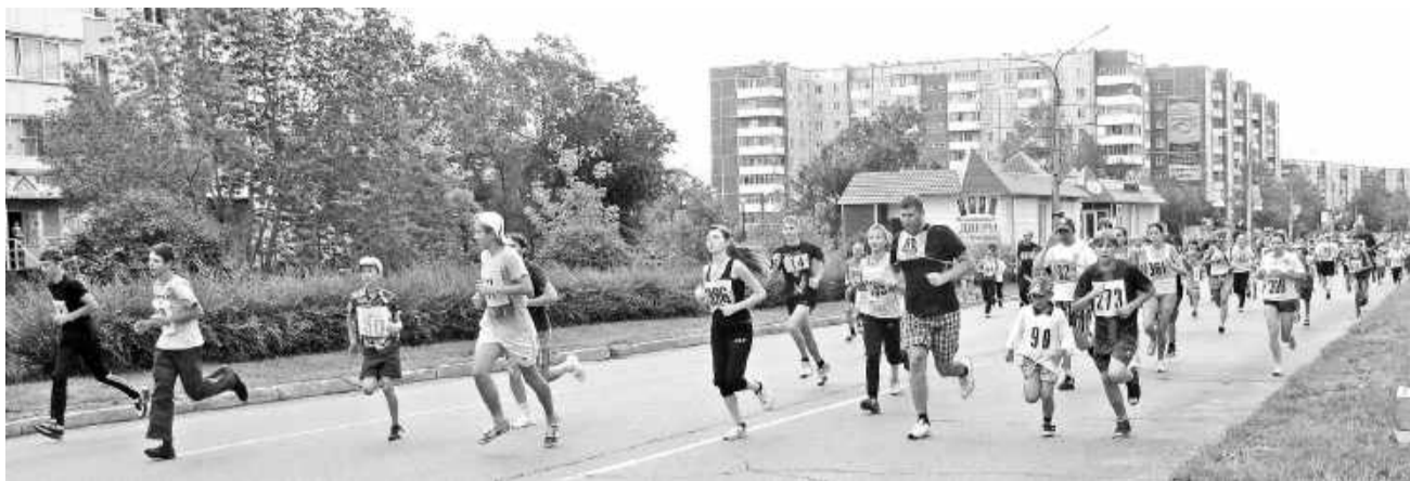
Саяногорское кольцо-2013

Дистанция 3 км - мужчины, женщины: - 1 группа - до 25 лет, 2 группа - 26-35 лет, 3 группа - 36-45 лет, 4 группа - 46-55 лет, 5 группа - 56 лет и старше.