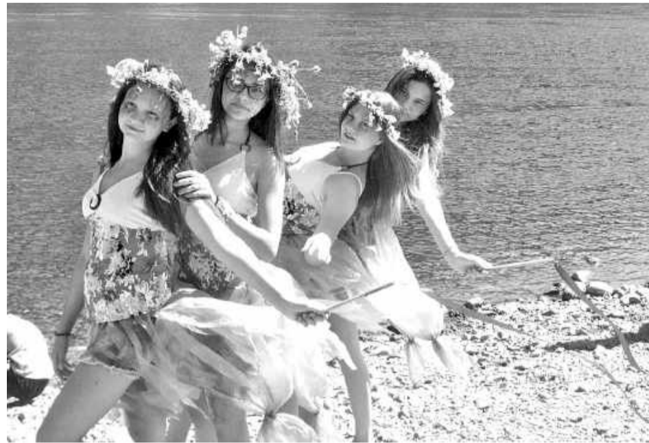
Танец русалок был очень зажигательным

В разгар праздника появились «русалки» и «черти». Они станцевали зажигательный танец и были изгнаны в глубины подводного царства. По старинной русской традиции, мальчишки и девчонки прыгали через крапивный костёр, чтобы весь год был удачливым и счастливым. Старинные народные игры, заклички Солнцу и Ветру, поиск волшебного цветка - всё приобрело сказочный смысл и делалось детьми с особым желанием.