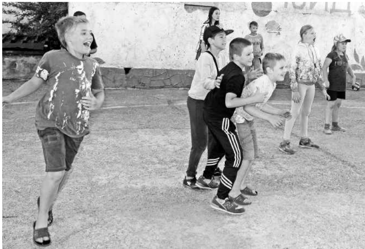
Одна из любимых игр детвора - «охотники и утки»

И повела меня детвора на асфальтированную площадку, где ребята разделились