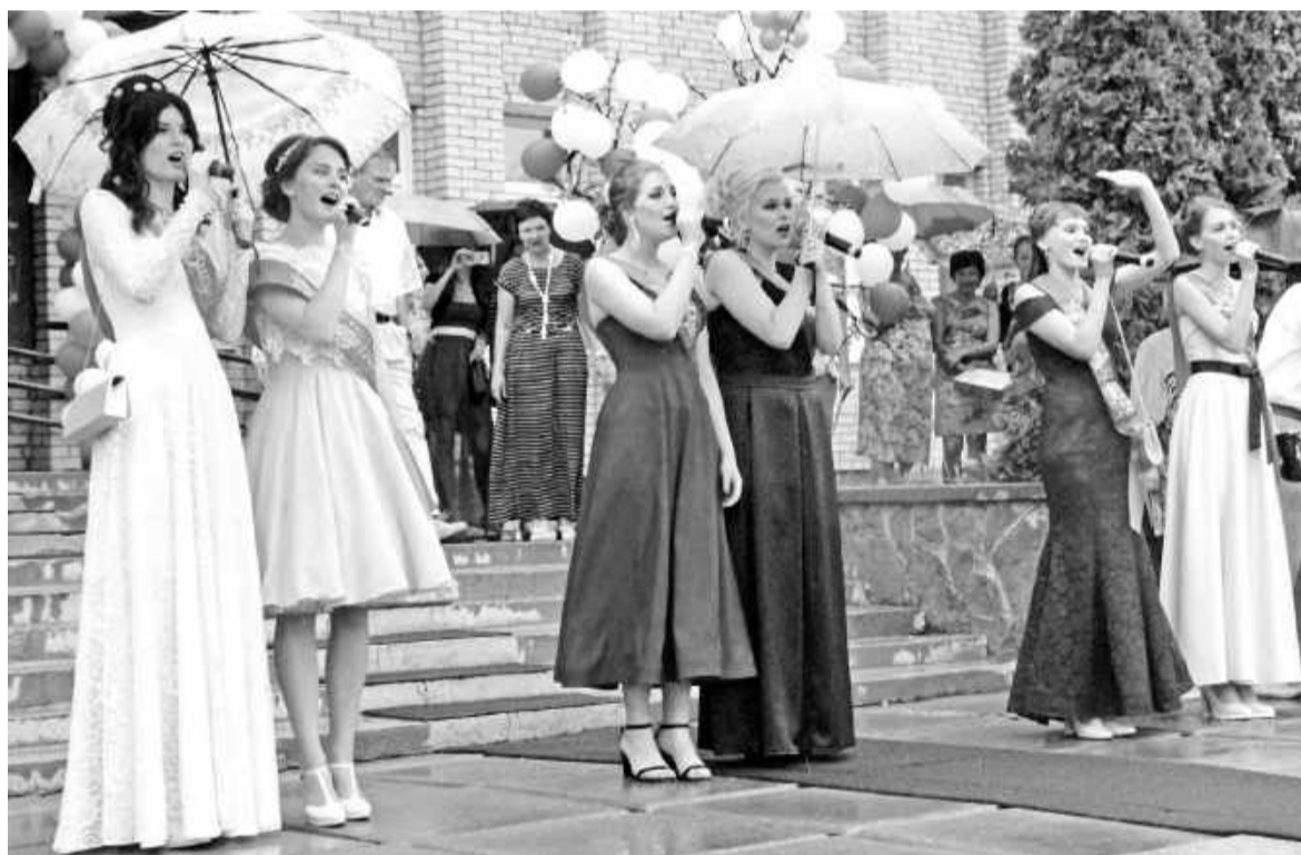
Музыкальное поздравление от выпускников

- Наоборот! Чтобы хорошо учиться, необходимо заниматься спортом. Спорт воспитывает в человеке целеустремленность, самодисциплину, ответственность, бойцовские качества. Бегайте, гуляйте на свежем воздухе, занимайтесь физкультурой, и всё будет хорошо!