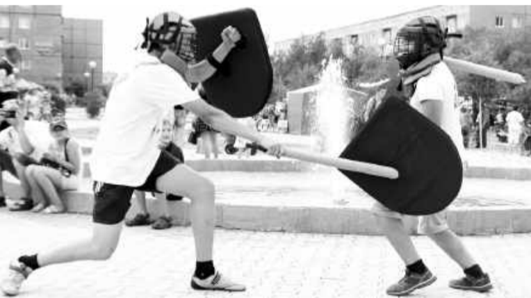
Тямбарный бой - азарт и безопасность