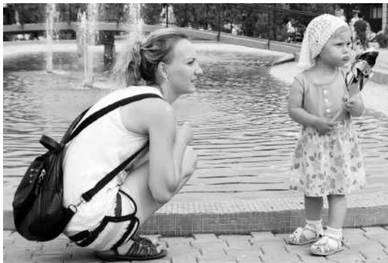
Фестивальным интересностям все возрасты покорны