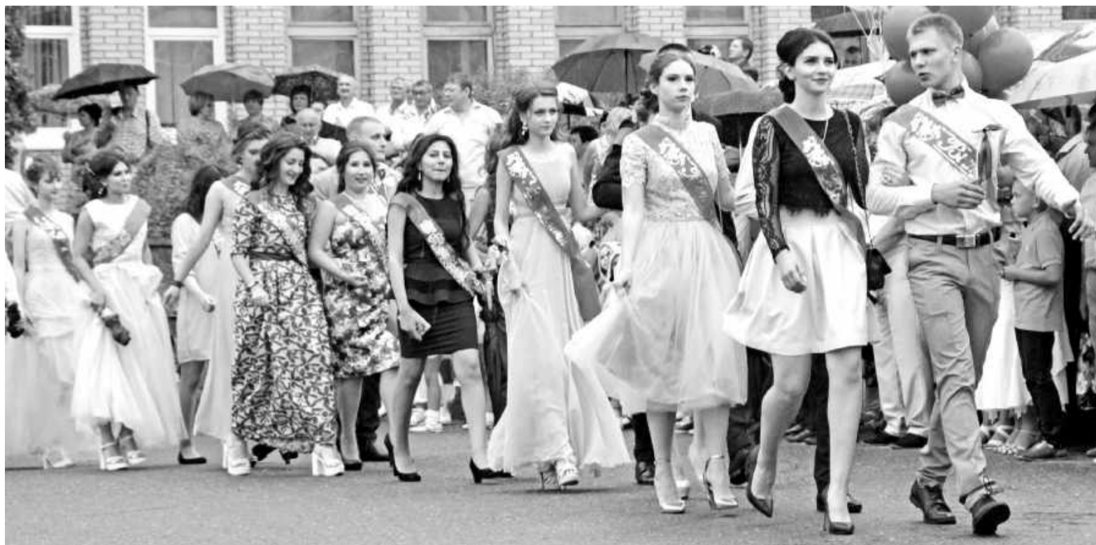
Первые шаги на новом пути