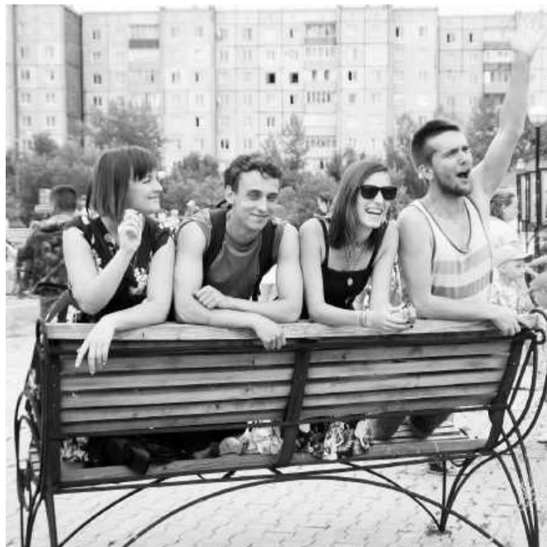
Даёшь горячие хиты!