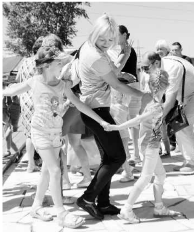
Этнокультурный центр «Ымай» превратился в праздничную площадку с интересными затеями для детей и взрослых

Зрители, расположившиеся у сцены «Ымая», с удовольствием покидали свои места и участвовали во всевозможных затеях: водили хороводы, играли в игры. Чего стоили одни «горелки», собравшие в свои стройные ряды самый разномастный народ - от несмышлёной детворы до солидных бабушек. И все это под чудесные русские песни - то задумчивые, то разудало-весёлые в исполнении Анастасии Шабановой, дуэта «Топотушки» и фольклорного народного коллектива «Енисеюшка».