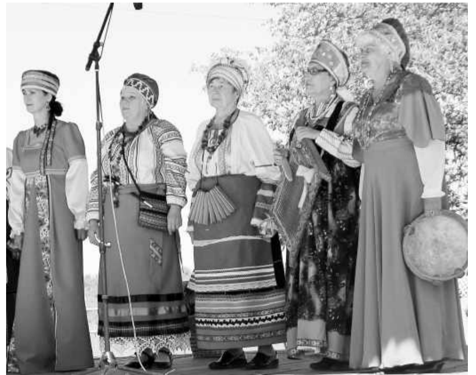
Разудало-веселые русские песни в исполнении фольклорного народного коллектива «Енисеюшка» создавали неповторимую атмосферу праздничного гуляния

Даже самым неактивным зрителям досталось доброй «березовой» энергии: ведущие не поленились пробежать по ярядам, обмахивая сидящих молодыми зелёны-