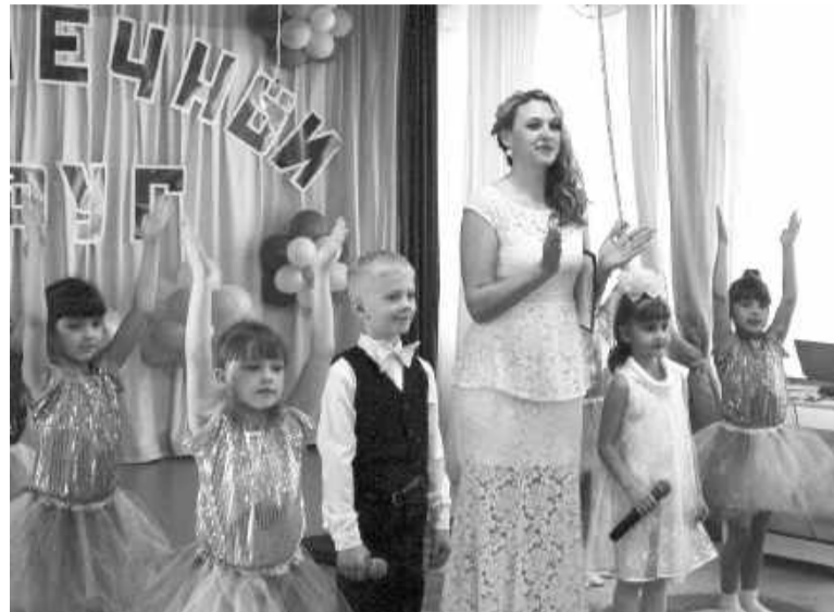
Детки поют, веселятся, танцуют, играют, радостью всех заряжают

Девять семей, которые участвовали в этом году, проявили свои таланты в трёх этапах конкурса. Первый - это номинация декоративно-прикладного творчества, которая ранее уже была оценена членами жюри, и работы представлены на выставке в фойе детского сада. Во втором каждый участ-