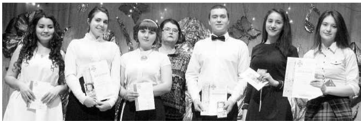
Юные поэты, сделавшие первые шаги в удивительный мир поэзии

Организаторами конкурса выступил филиал ДК «Визит» рп. Майна и комитет по делам молодёжи, физической культуре и спорту администрации МО г. Саяногорск. Оценивало выступление участников компетентное жюри в составе начальника комитета по делам молодёжи, физической культуре и спорту Юрия Бережного, члена Российского союза писателей и регионального представителя