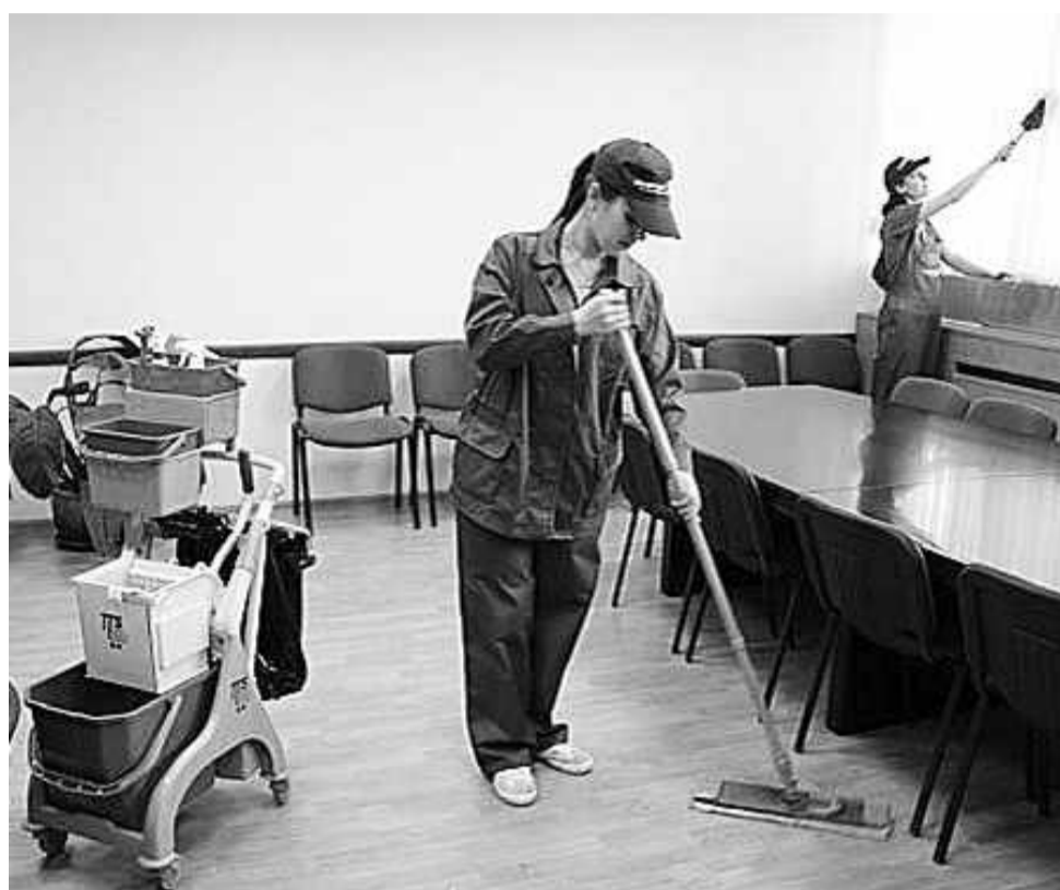
Качественная уборка вашей квартиры или офиса - наша работа

Хорошей традицией является семейный поминальный обед, когда говорят о том добром, что связано с именем умершего родственника.