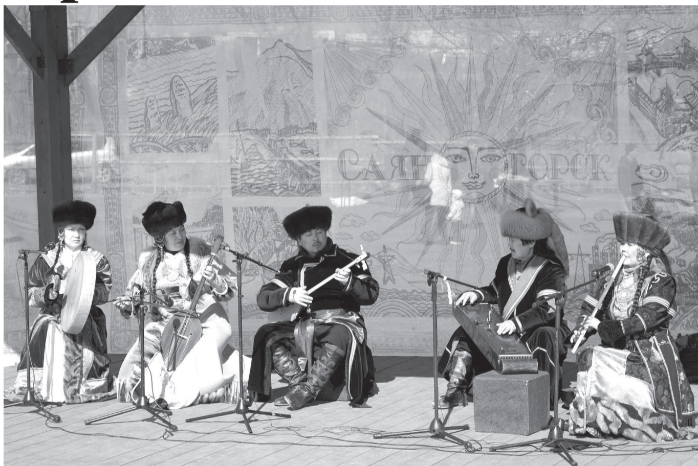
Музыка хакасских степей от фольклорного ансамбля «Айланис»

В пятницу Саяногорск впервые отметил хакасский новый год - Чыл Пазы - на своей земле.