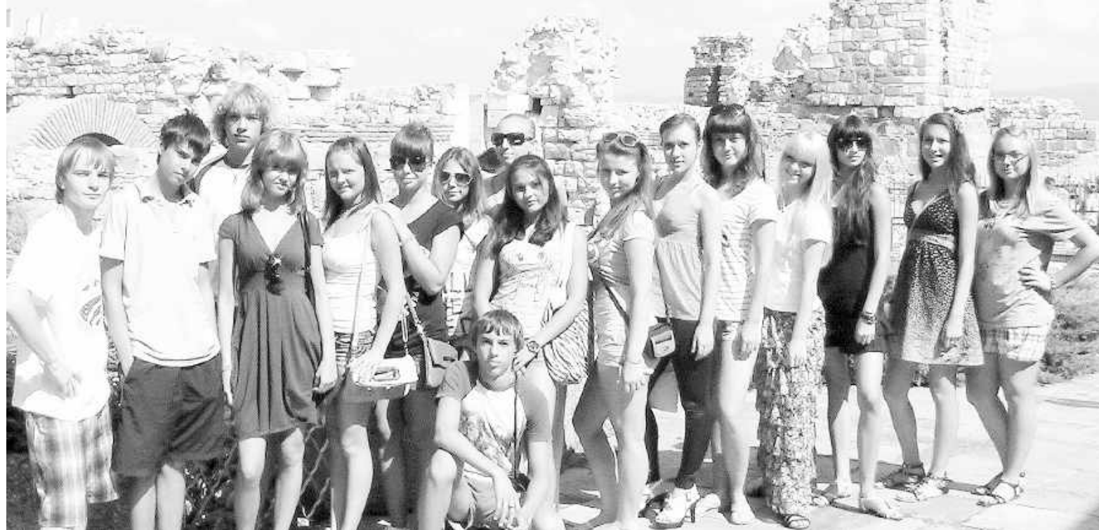
Солнечная Европа радушно встретила сибирских ребят