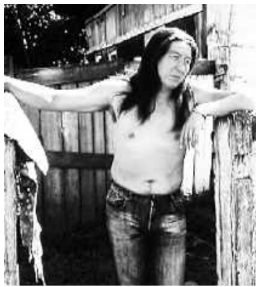
Главный герой Макс (кадр из фильма)

В одну из поездок именно в этом месте у него сломался автомобиль. Никакие усилия заставить его ехать дальше не помогли: Макс с отчаянием сел возле машины. Оглянувшись,