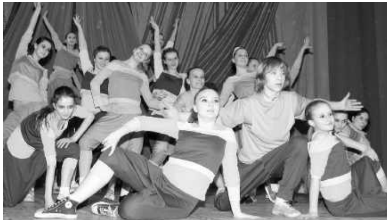
Только танец сможет передать шквал эмоций, заразить гаммой чувств...