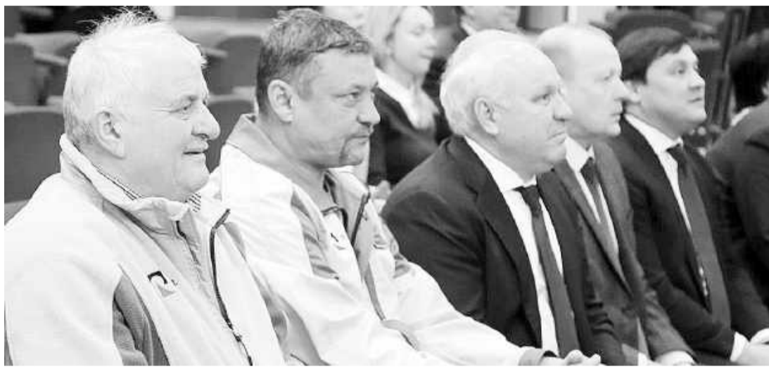
Руководителям предприятий и Главе региона предстоит осуществить ещё не один совместный проект

Строительство рассчитано на два года. На сегодня выполнены постройки избы и юрты, которые наполнены экспонатами для проведения экскурсий, обустроена смотровая площадка и этническая культурная зона, отведена игровая зона с соблюдением старинных русских традиций, изготовлена сценическая площадка. Объект электрифицирован, оснащен охранно-пожарной сигнализацией и системой видеонаблюдения. Когда музей под открытым небом будет достроен, в нём будут