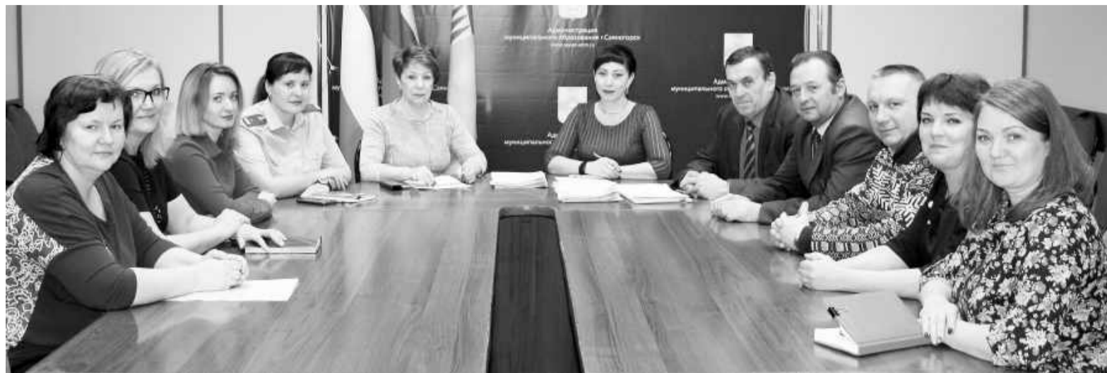
Административная комиссия - серьезная помощь местным властям в наведении порядка и соблюдении гражданами административного законодательства