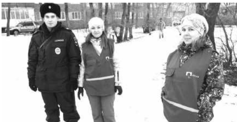
Дружинники-металлурги прошли обучающие курсы, сдали тесты на знание закона и теперь имеют полное право помогать стражам порядка

сотрудниками ППСП и ГИБДД Саяногорской полиции.