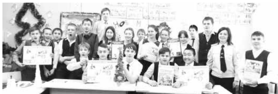
Отныне ребята в школе № 1 знают, что безопасность - главный принцип, который обязательно должен соблюдаться при дорожном движении

Кроме того, в обсуждениях была затронута тема «дорожных ловушек». Госавтоинспекторы настоятельно рекомендовали: прежде чем выйти на проезжую часть, обязательно необходимо убедиться в безопасности - выглянуть из-за препятствия (сугроба, заснеженной машины). А для повышения видимости пешеходов в темное время использовать световозвращающие элементы, чтобы заранее привлечь внимание водителей. В завершении встреч полицейские желали детям беззаботных, веселых и безопасных каникул.