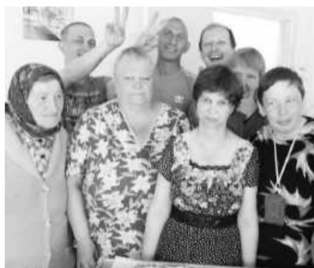
Международный день инвалидов - значимый праздник, призванный напомнить людям, которым повезло быть здоровыми, об их собратьях, которые имеют ограниченные физические возможности