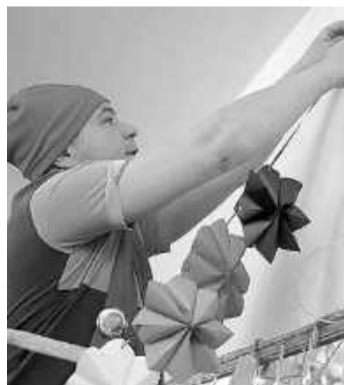
Добрики украшают зал к Новому году в детском доме «Ласточка»

Семь команд волонтеров Саяногорска завершили прохождение очередной станции годового благотворительного марафона РУСАЛа «Верим в чудо, творим чудо!». В течение двух недель они проводили мероприятия в подшефных социальных учреждениях города.