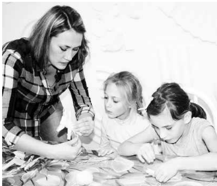
Куклы своими руками - увлекательное занятие

История народных кукол завораживает, а создавать их безумно интересно! Их мастерили (смащивали, скручивали, сворачивали) неспешно, обстоятельно. С надеждой и, главное, с большой любовью. А потому в процессе изготовления не использовали ни ножниц, ни иголок. Детали кукол не сшивали, а связывали между собой, приматывали друг к другу. При этом загадывали желания, напевали, приговаривали или читали молитвы. Отсюда и положительная энергетика, которую мы, глядя на кукол, неосознанно испытываем. Кстати, в большинстве случаев