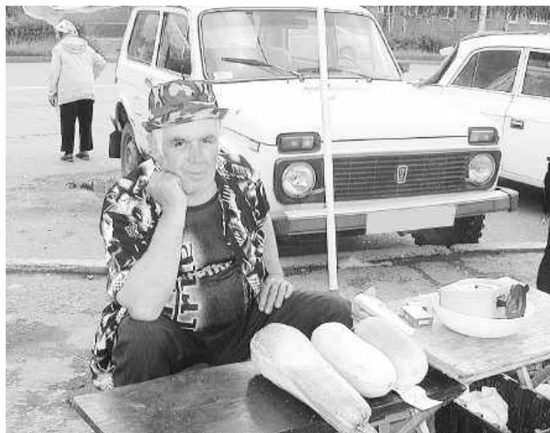
Среди незаконных торговцев подавляющее число - пенсионеры. Им тоже следует перейти со своей огородиной на муниципальный рынок или на «Ролби»

Спешат в историю десятилетия, а проблемы остаются прежними. В настоящее время, например, ребром встал вопрос несанкционированной торговли у «Кантегира» в Ленинградском микрорайоне и у торца здания городского узла связи в Енисейском. Для решения любой пробле-