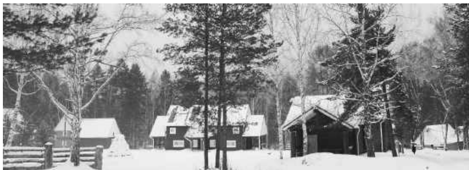
База отдыха «Сюгеш» с её горнолыжной трассой популярна среди любителей активного зимнего отдыха