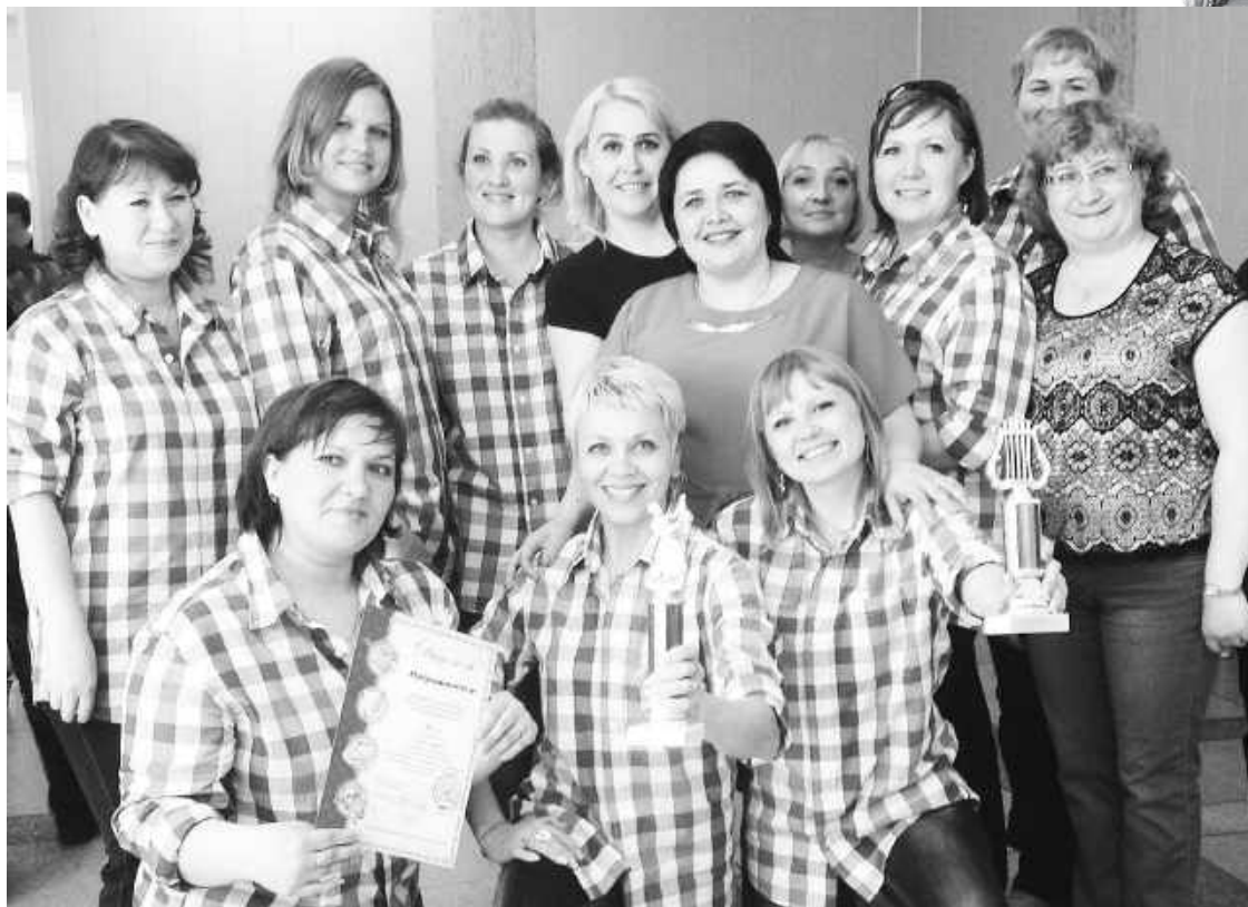
10 сентября 2016 г. состоялась туристический слёт работников образования г. Саяногорска. Команда «Молодёжь» - смелые, весёлые, дружные, умелые и красивые «цветочки» заняли III место в конкурсе песни

В то время многие женщины готовы были работать в детском саду ради своих детей. К тому же детишек сотрудников принимали вне очереди, так и появились «новоиспечённые» педагоги, из которых остались единицы, а случайные люди отсеялись. Постепенно коллектив набирался опыта и пополнялся работоспособными творческими специалистами. С первых дней своего образования «Аленький цветочек» славится интересными, креативными праздниками, на которые до сих пор приходят коллеги из других детсадов города перенять опыт.