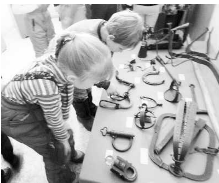
Экскурсия - это так познавательно!

Путешествие по «Саяногорскому кольцу» продолжилось на звероферму в Черёмушки. Дети были уже наслышаны о её главной достопримечательности - страусе Трубаче. Они с восхищением старались запечатлеть всё, что увидели: