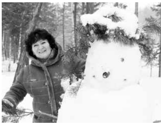
Смешного, нелепого, но симпатичного и забавного снеговика слепили дети отдыхающих