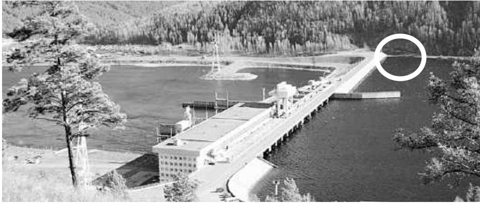
Правобережная часть Майнской ГЭС упирается в остатки крепости Омай-тура (выделено на фотографии)

Например, пятиглавый Борус - священная для каждого хакаса горная вершина. Как гласит предание, в давние времена жил вещей старец Борус, который предвидел всемирный потоп. Он соорудил корабль, куда посадил всех зверей и птиц. Лишь мифический зверь аргылан (мамонт) и птица гаруда (двуглавый орел с телом чело-