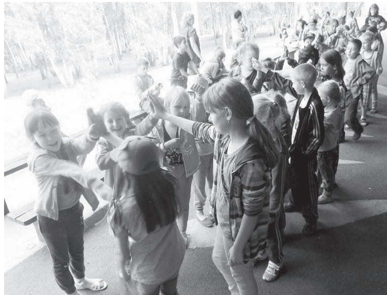
Традиционное мероприятие лагеря флешмоб «Ручеёк»

В лагере проводится масса спортивных состязаний: товарищеские матчи по футболу собирают у поля болельщиков. Даже медсестры и повара после смены заглядывают сюда, чтобы