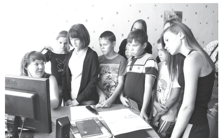
Материалы страницы подготовила Наталья ТАРАПА

В конце встречи сотрудники газеты напоили ребят чаем, обменялись мнениями. И те и другие остались довольны творческой встречей!