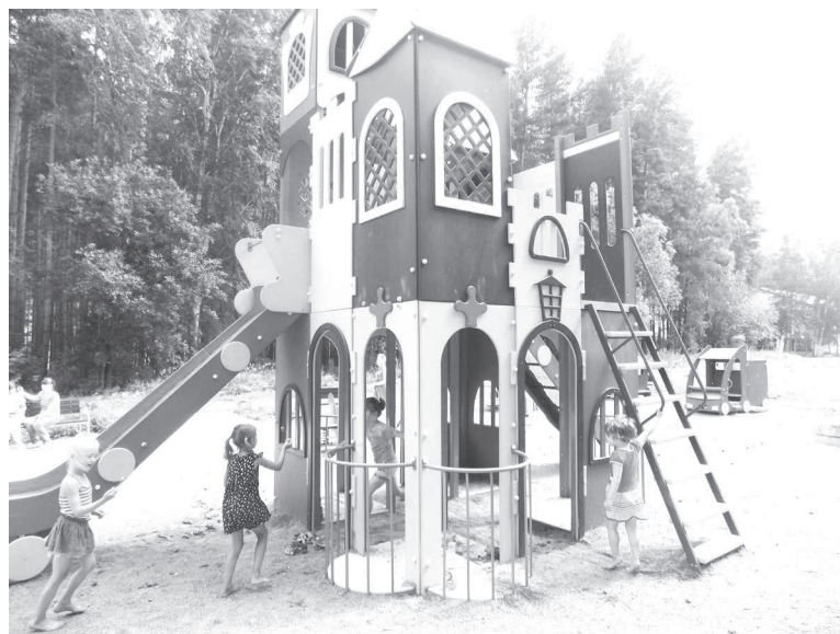
Детская площадка в черёмушкинском парке

- Раньше мы просто приходили на Енисей, садились