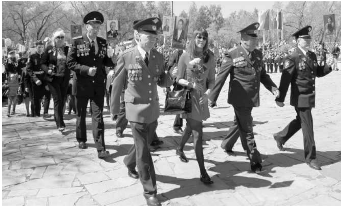
Шагают участники акции «Бессмертный полк»

твой брат? Почему бабушка не ездит в гости к своим родным?