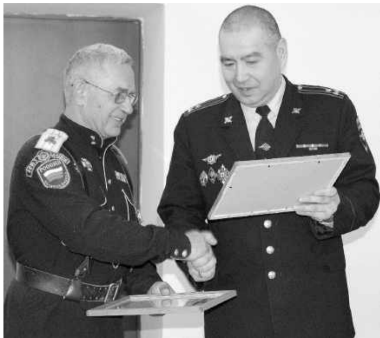
Удостоверения дружинников - казакам

продолжают нести службу в рядах ДНД и не намерены отступать на обочину жизни.