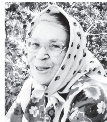
На пороге 90-летия