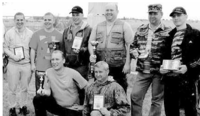
Победители очередной товарищеской встречи