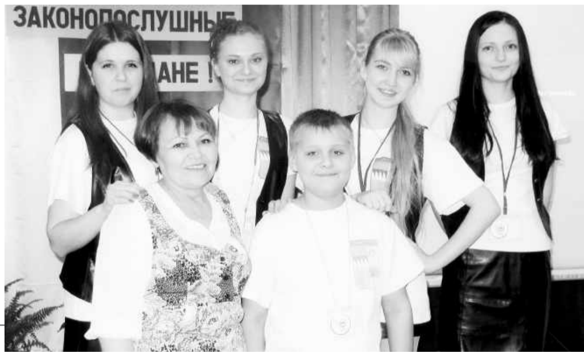
Мы - команда

своей малой родине. К обим праздникам мы делаем спецвыпуски нашей газеты. Я пытаюсь вносить разнообразие в каждое занятие. Изучив теорию, мы переходим к написанию материалов в изученных жанрах. У младших по возрасту - это небольшие эссе, а у ребят постарше - довольно серьезные журналистские работы.