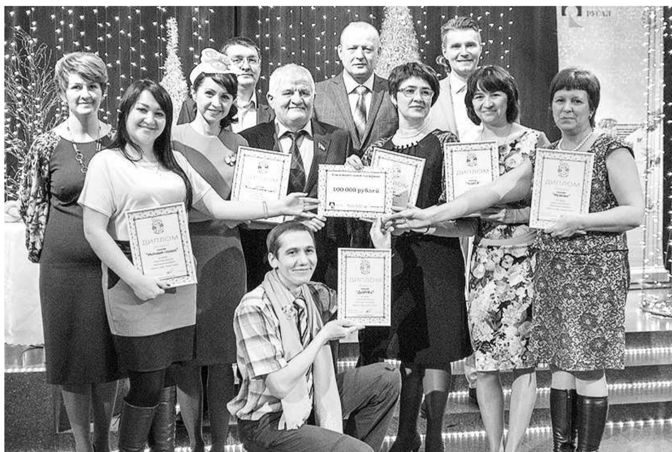
Творят чудеса обыкновенные люди

Саяногорские волонтеры – участники традиционного Новогоднего марафона РУСАЛа «Верим в чудо, творим чудо!» разделили 100 тысяч рублей призового благотворительного сертификата между двумя юными саяногорочками, нуждающимися в срочной медицинской помощи.