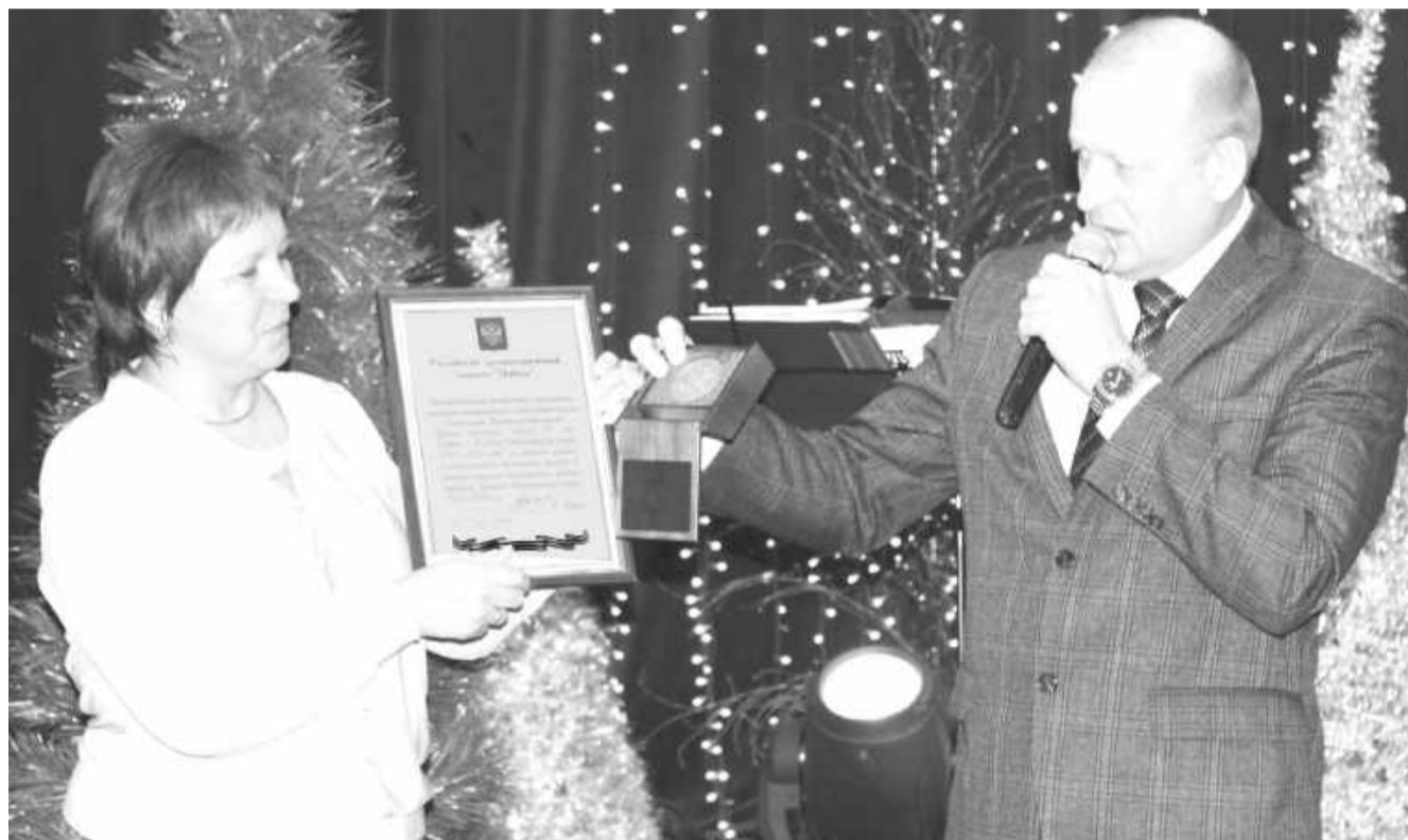
Торжественный момент награждения

Саяногорский краеведческий музей получил памятную медаль «70 лет Победы в Великой Отечественной войне 1941-1945 годов» Российского организационного комитета «Победа» за подписью Президента Российской Федерации Владимира Путина.