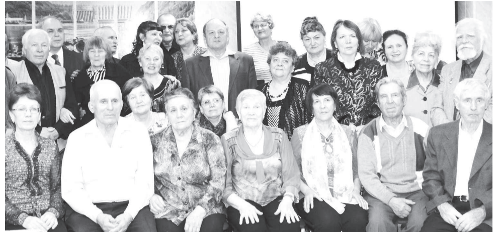
Встреча «Стрежня» с «Зеленой лампой», март 2015г.