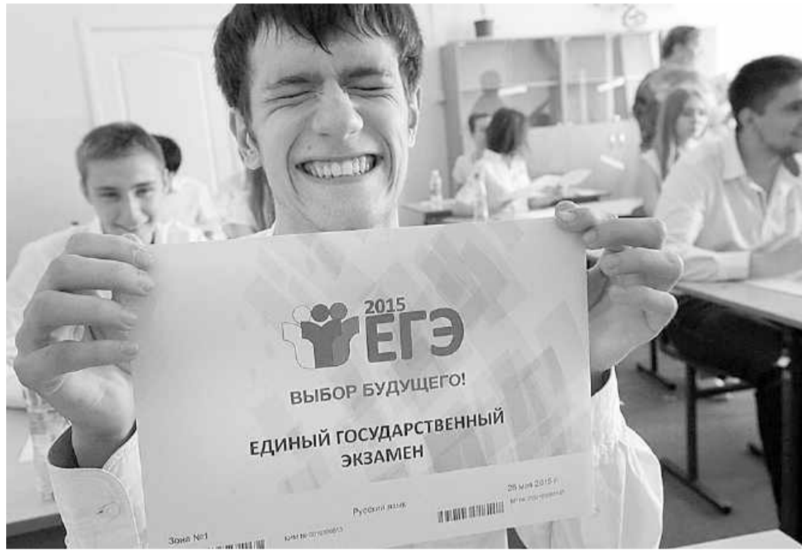
Страшно - аж жуть!

На госэкзамене-2016 выпускники больше не будут играть в «угадайку». Специалисты Минобрнауки РХ рассказали об отмене тестирования и других особенностях ЕГЭ этого года