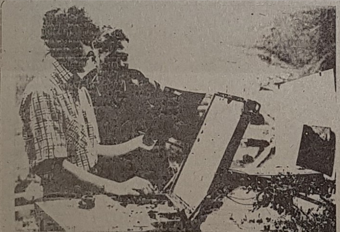
В МИРЕ УВЛЕЧЕНИЙ