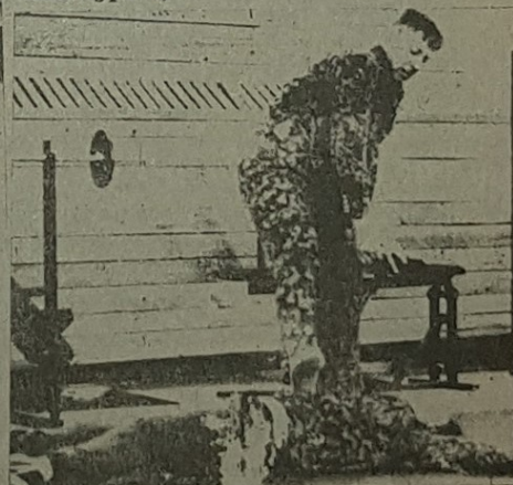
Высокий профессионализм охранной службы.

Наш адрес в г. Саяногорске: ул. Металлургов, 3.