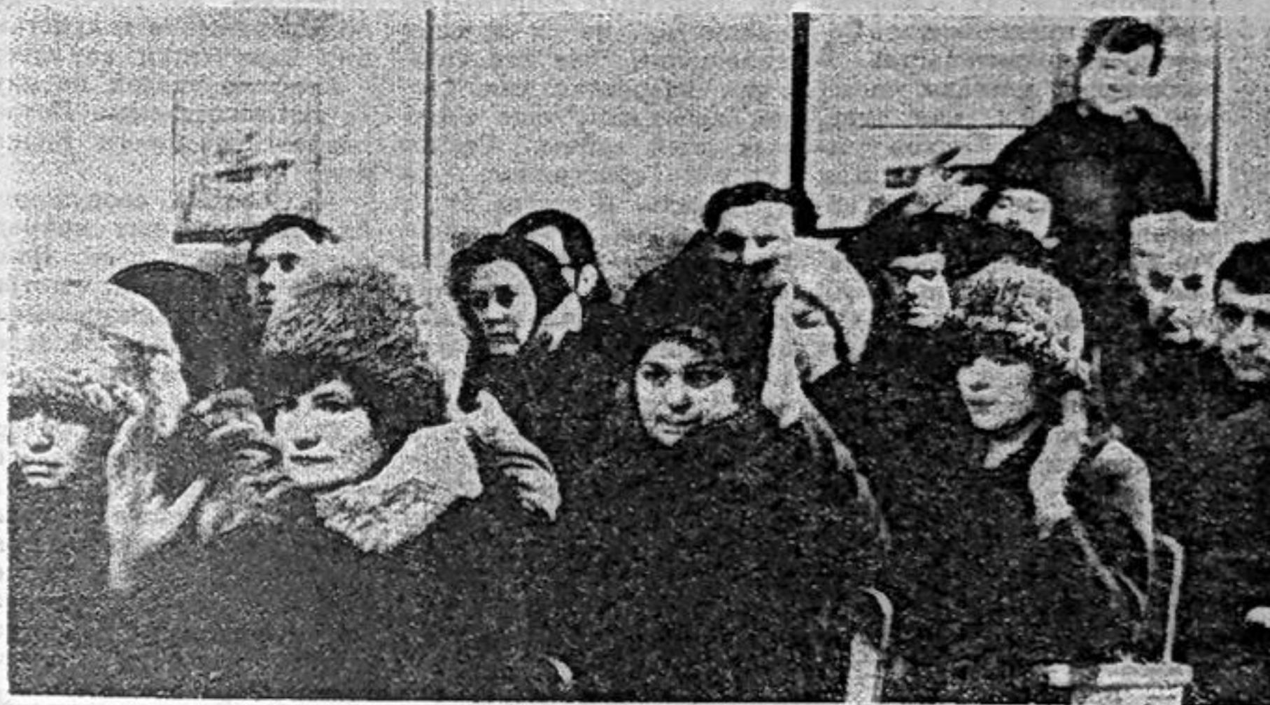
Дворец культуры «Энергетик» — участники предвыборного собрания.