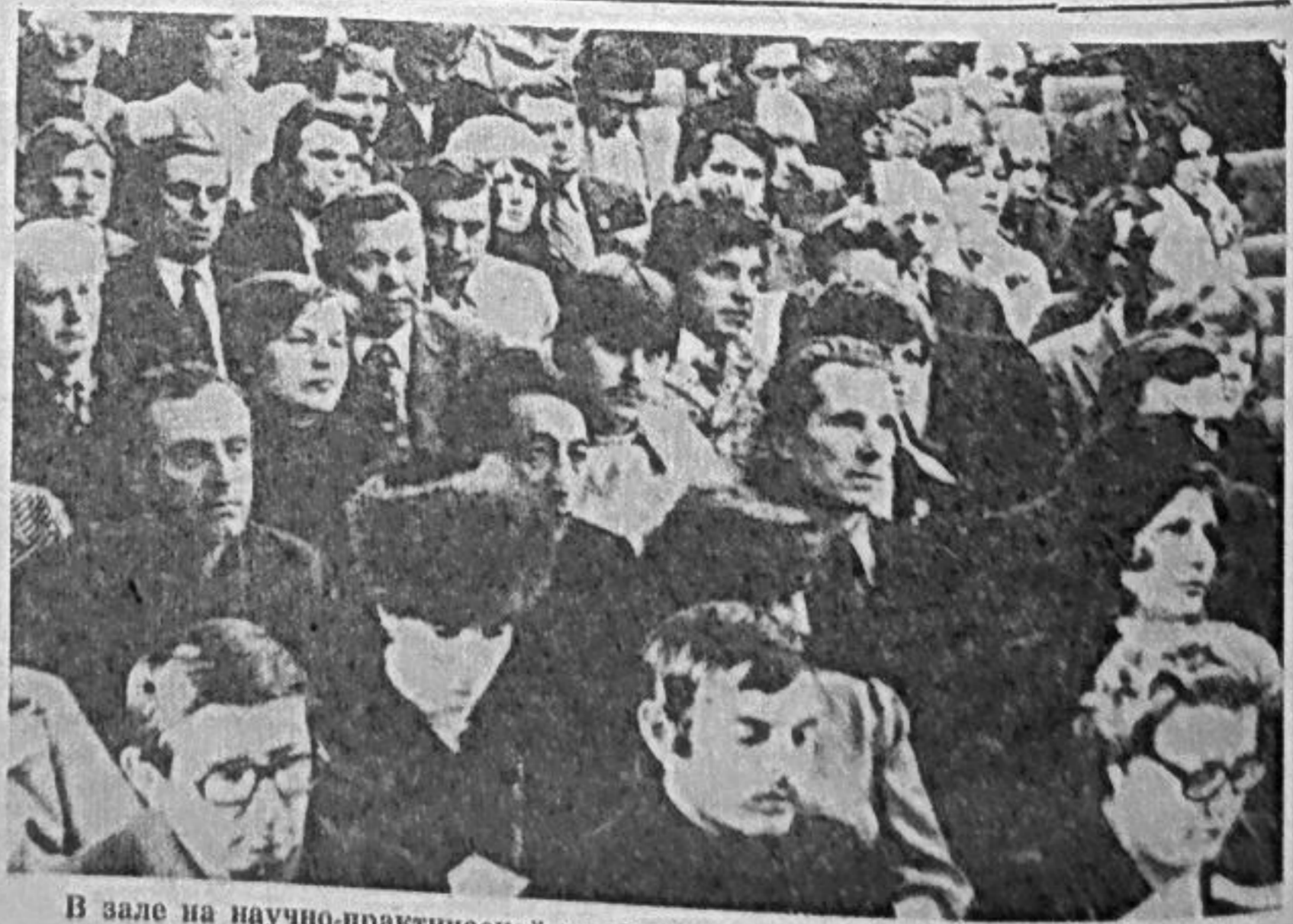
В зале на научно-практической конференции.

Хакасская автономная область является солидной частью Саянского территориально-производственного комплекса. В декабре 1978 года, когда действовал первый агрегат Саяно-Шушенской ГЭС, в летописи области открыта новая замечательная страница: она стала поставщиком электроэнергии, которая сыграла большую роль в развитии производительных сил Сибири, названной В. И. Лениным чудесным краем, с большим будущим.