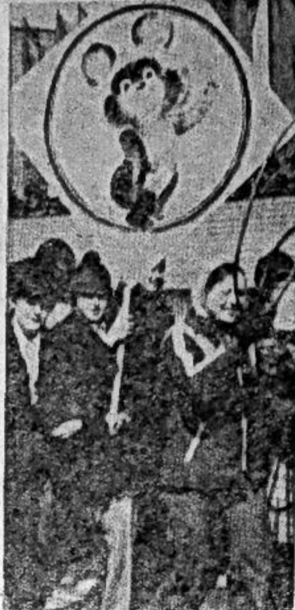
1 МАЯ 1980 ГОДА; ПРАЗДНИЧНАЯ ДЕМОНСТРАЦИЯ ТРУДЯЩИХСЯ САЯНОГОРСКА.