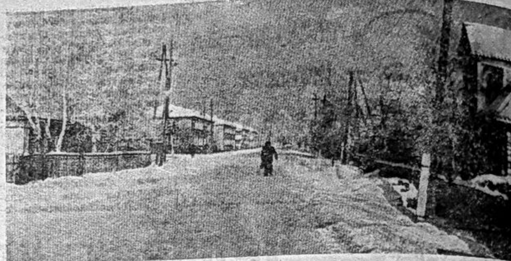
Побелок Майна в солнечный день.