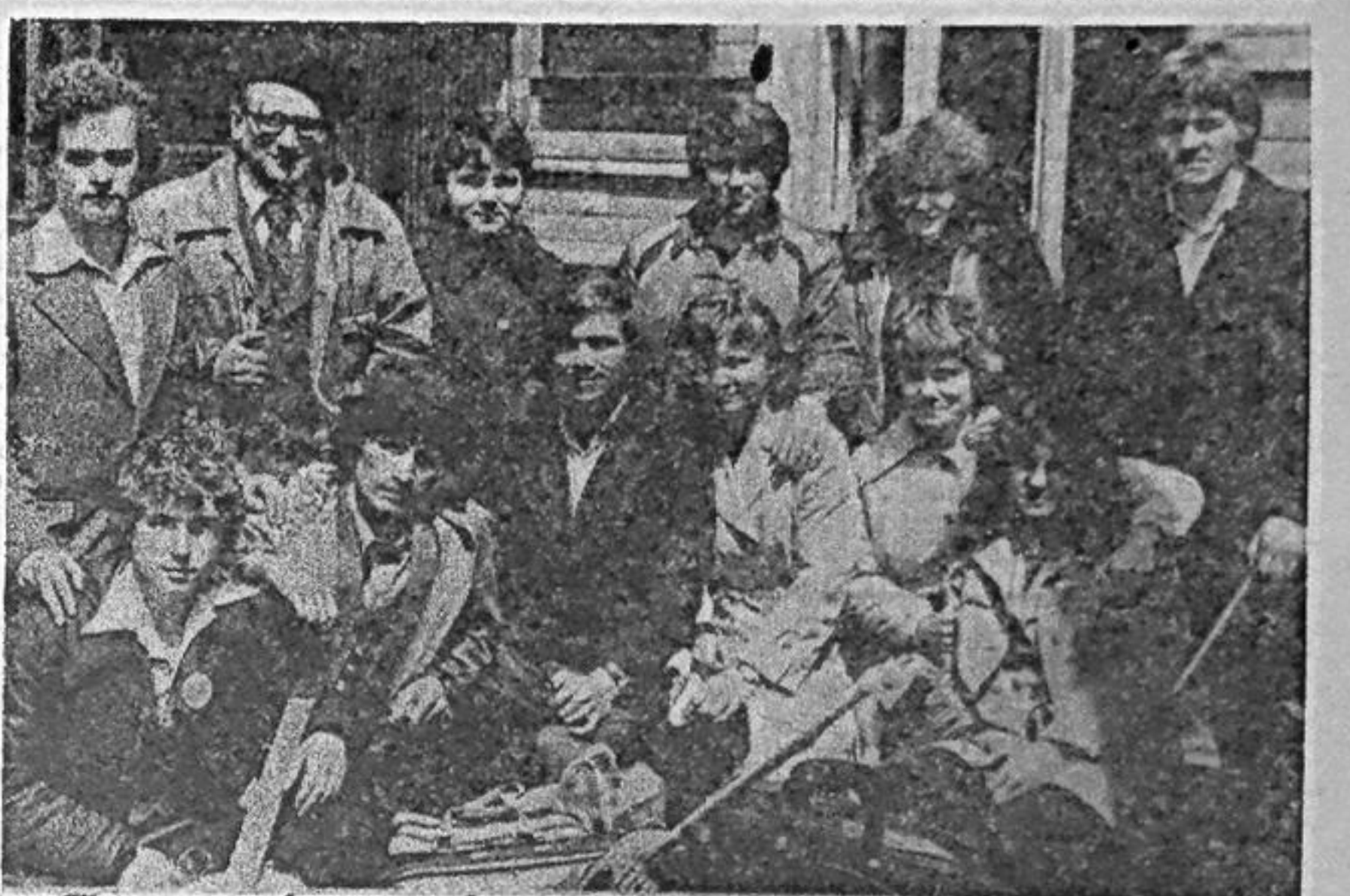
Каждый год на строительство Саяно-Шушенской ГЭС приезжают сотни студентов техникумов, институтов страны. Здесь, работая плечом к плечу с гидростроителями, они приобретают богатый практический опыт. На снимке: студенты третьего курса Беловского энергостроительного техникума, приехавшие на производственную практику в Саяны.

водственного плана коллективом, выполнение личного творческого плана, а также учитывается внедрение передовых методов труда и новой техники, изобретательская и рационализаторская работа в коллективе, совершенствование своих знаний, участие в спорте и общественной жизни коллектива. Лучший инженерно-технический работник определяется по наивысшей сумме баллов, начисляемых за основные и учитываемые показатели, поощряется согласно условиям социалистического соревнования. Т. МАНЬШИНА, инженер НИС-55.