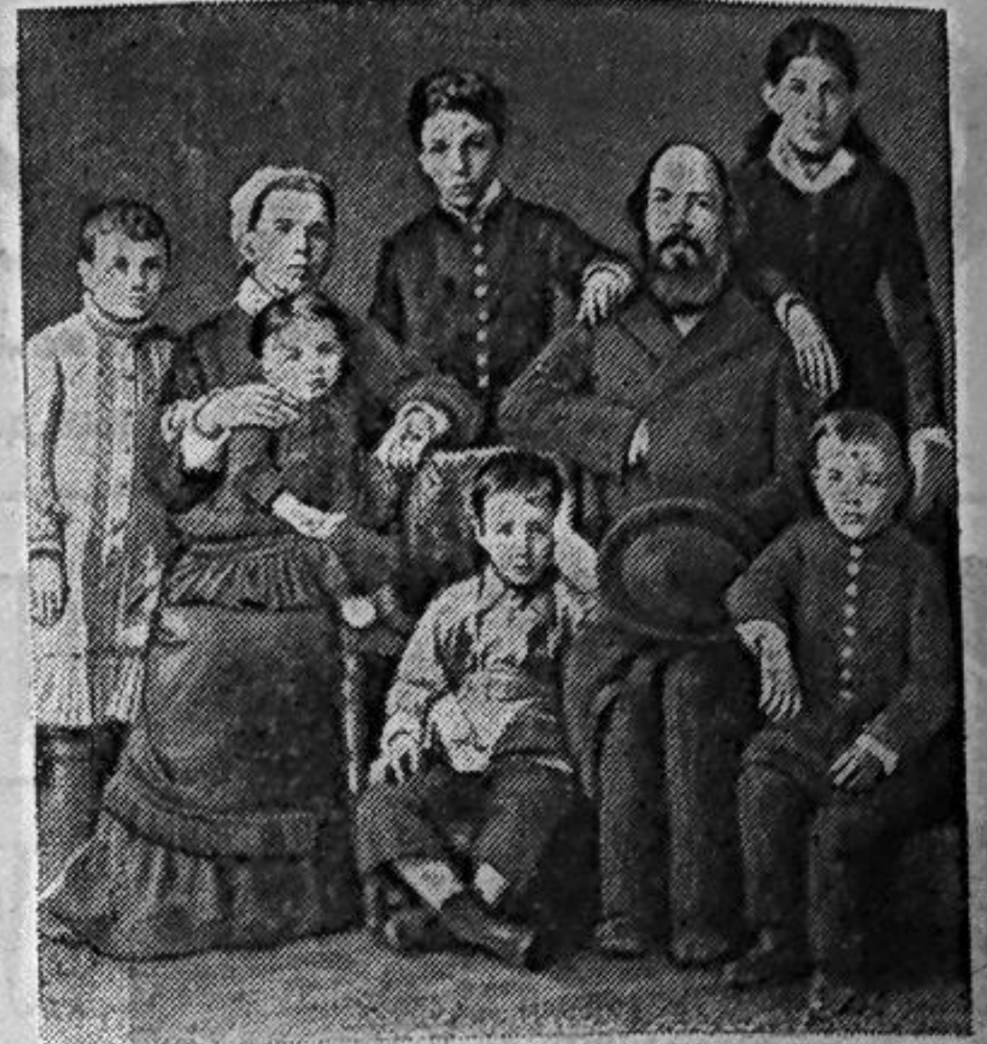
СЕМЬЯ УЛЬЯНОВЫХ. (1879 ГОД).

В 1922 году по инициативе участников первого засева исторического поля и комсомольцев-механизаторов совхоза-тех-