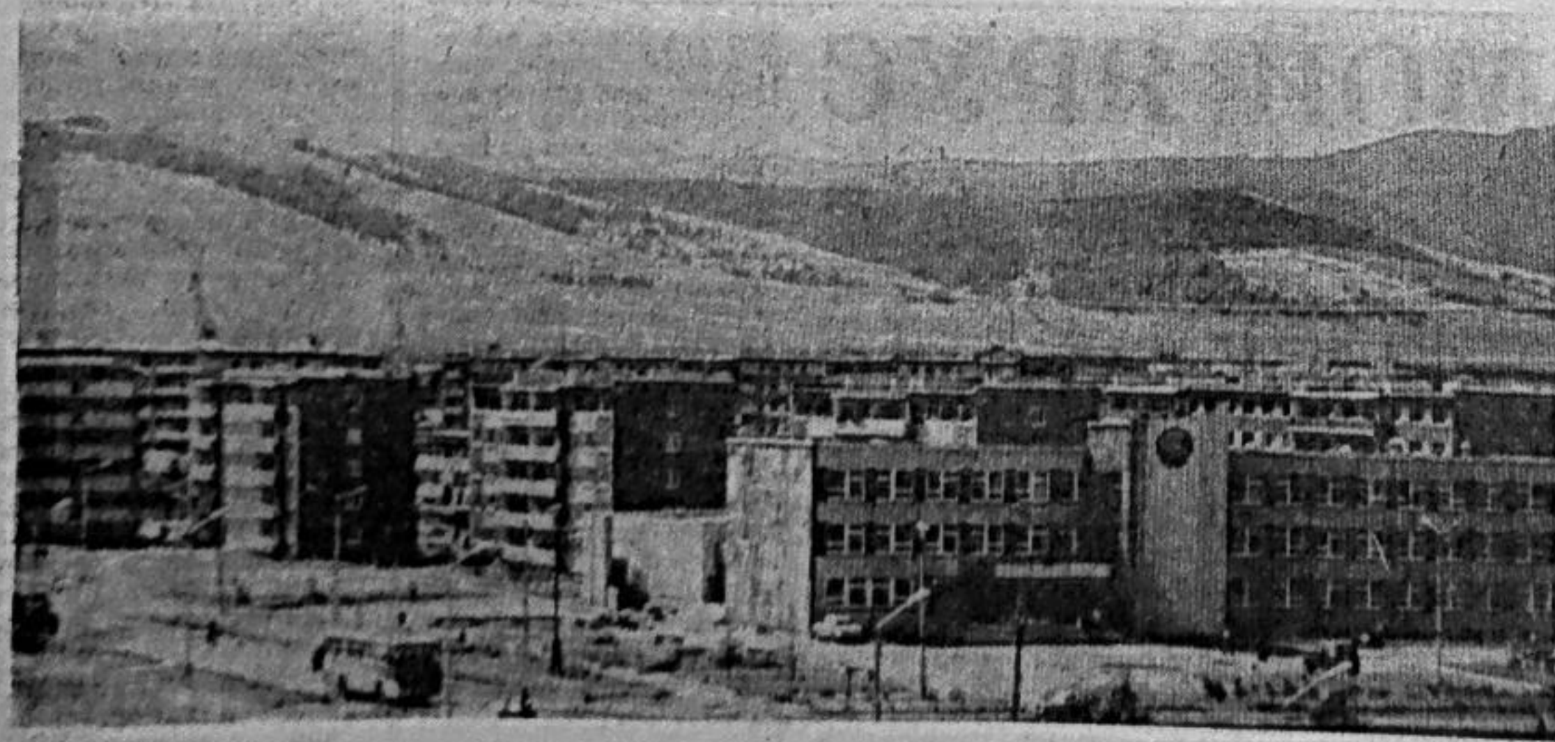
У подножия Саян растет город энергетиков, камнеобработчиков, металлургов.

(Герберт Уэллс, английский писатель-фантаст).