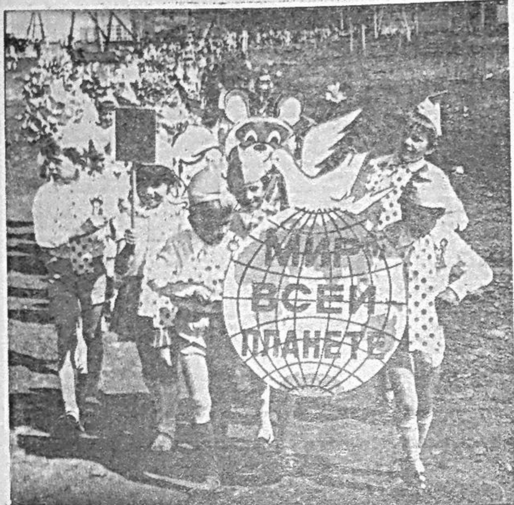
Настоящим праздником стал день 1 июня для саяногорской детворы. Принаряженные, в разноцветных пилютках, с цветами и игрушками, казались, нескончаемой колонной шли они в городской парк на праздник.

Пенне, танцы, стихи, рисунки на асфальте, да и сам праздник — все говорило об одном: нам нужен мир, солнце, счастливое детство.