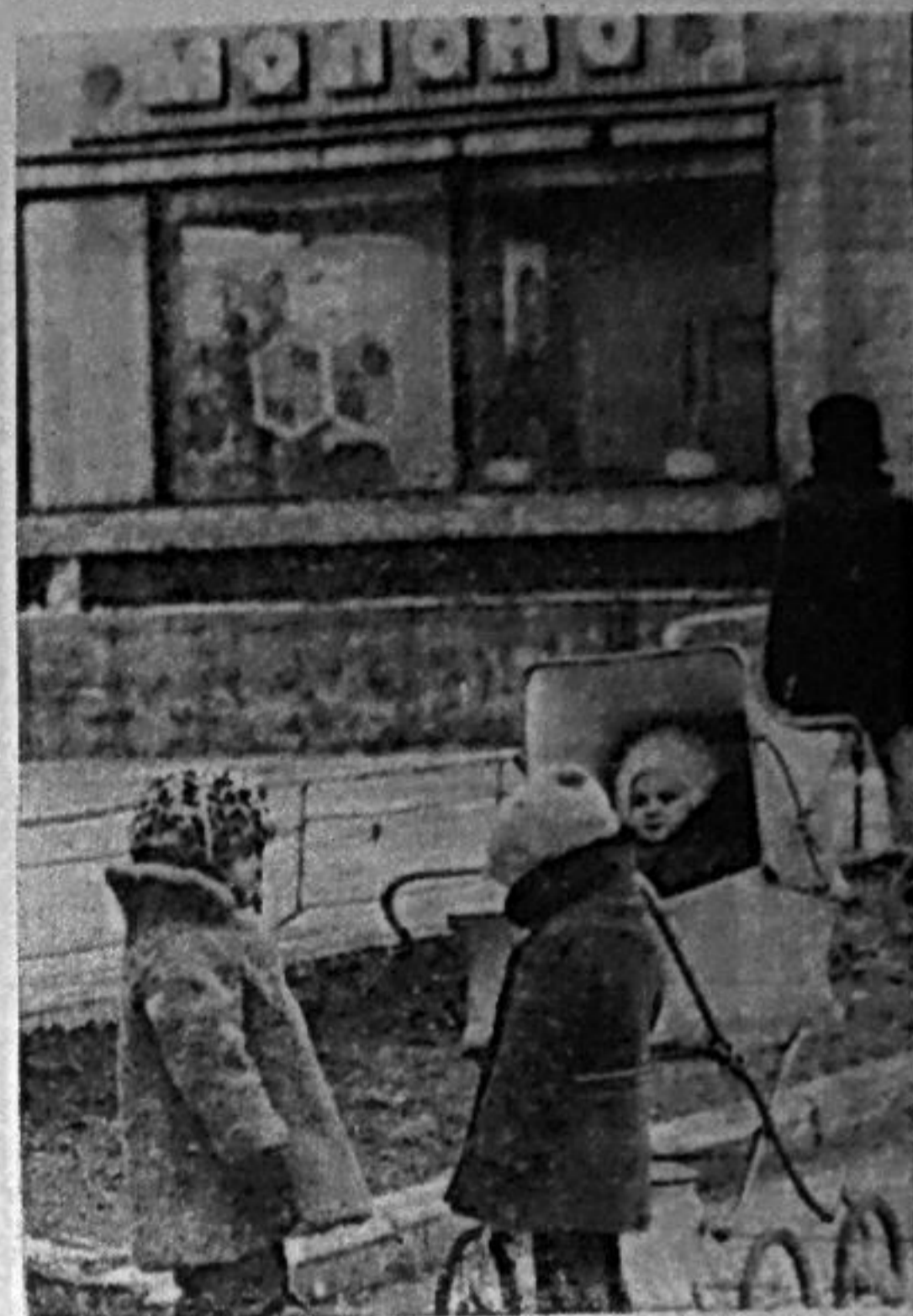
Встретились друзья.

Н. ТЕРЕШИНА, начальник Саяногорского отделения «Союзпечать».