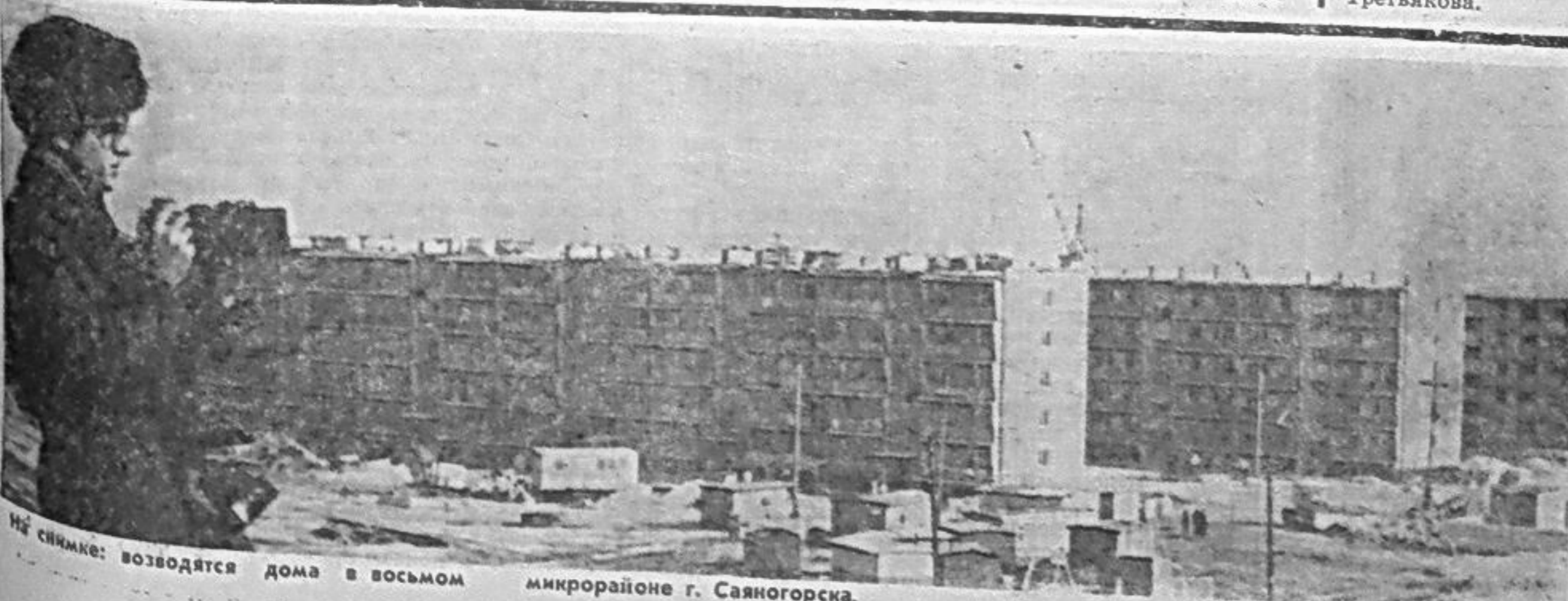
На снимке: возводятся дома в восьмом микрорайоне г. Саяногорска.

Правление городской организации общества «Знание».