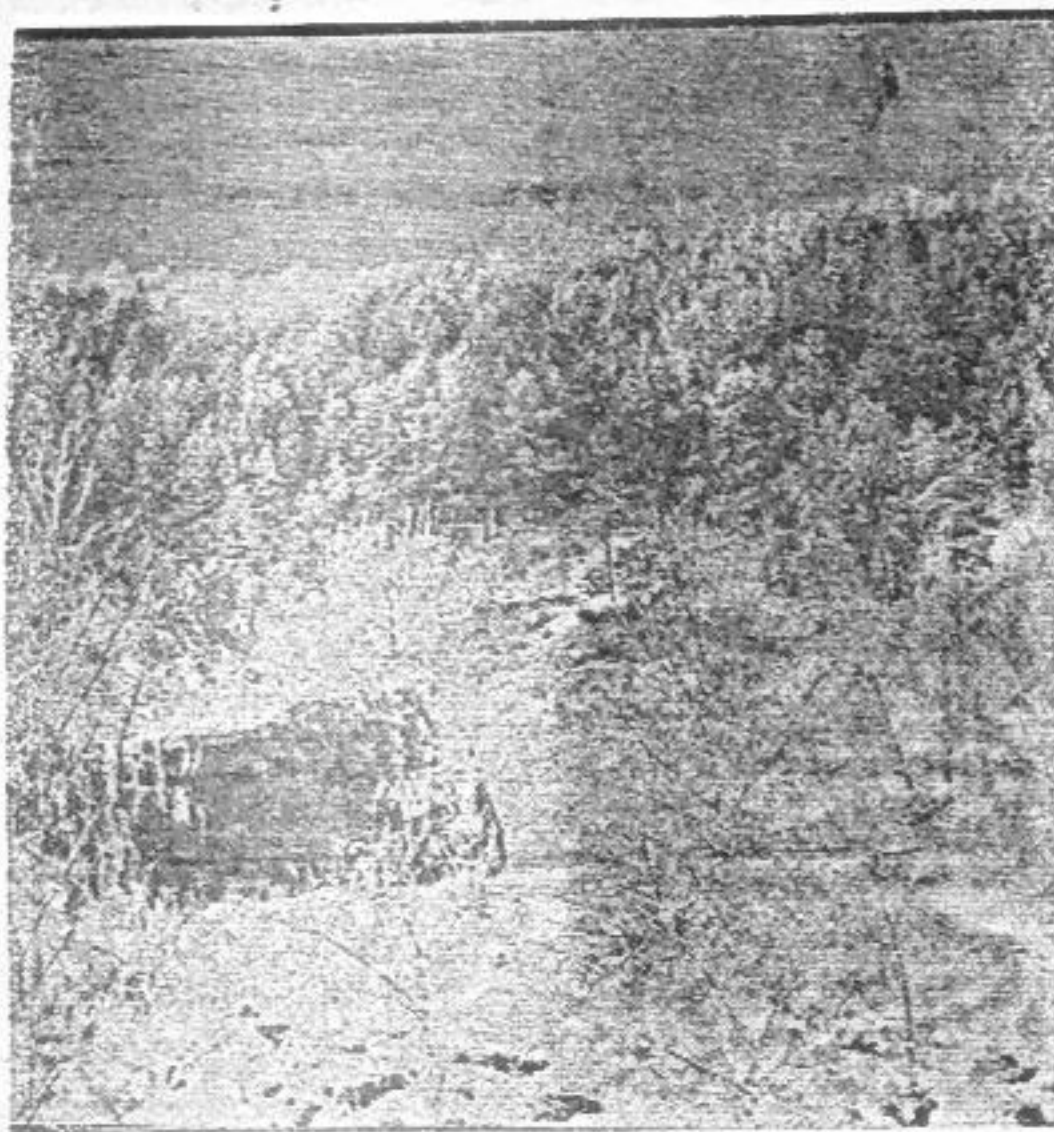
САЯНСКИЙ ПЕЙЗАЖ.