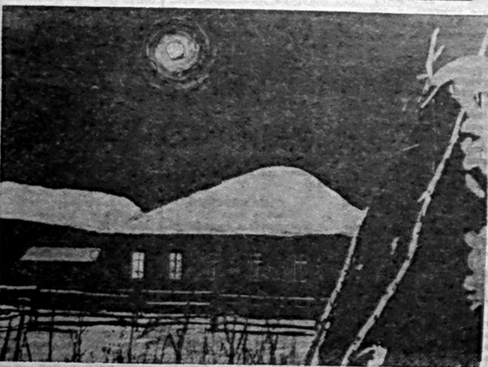
ЛЕНИНСКИЕ МЕСТА СИБИРИ