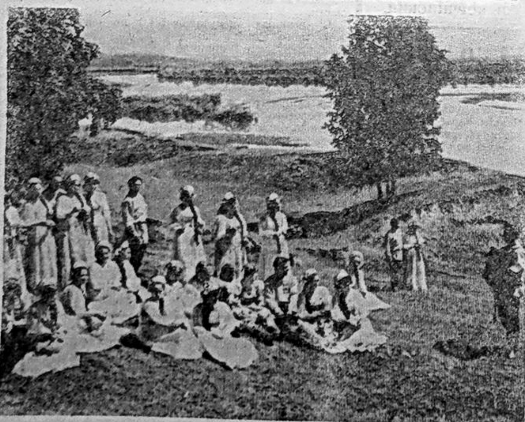
Безмерна народная любовь к Ленину. «Нет человека, который столько сделал бы для счастья людей труда, для свободы, процветания и величия нашей Родины, для освобождения угнетенных и эксплуатируемых во всем мире», — сказал Л. И. Брежнев на открытии Мемориального комплекса в Ульяновске. На снимке: Шушенское, широки просторы над речкой Оя — там, где любил бывать Ильич. Первая песня о Ленине, выступает Шушенский ансамбль песни и танца.

Необходимо теперь составить план работы рабочих групп и советов по комплексному планированию экономического и социального развития города и приступить к его выполнению. Хотелось бы отметить, что участие социологов в разработке плана, образно говоря, позволяет поднять на уровень работу по планированию городов, трудовых коллективов с одной стороны, а с другой — «приземлить» науку до уровня практических требований дня.