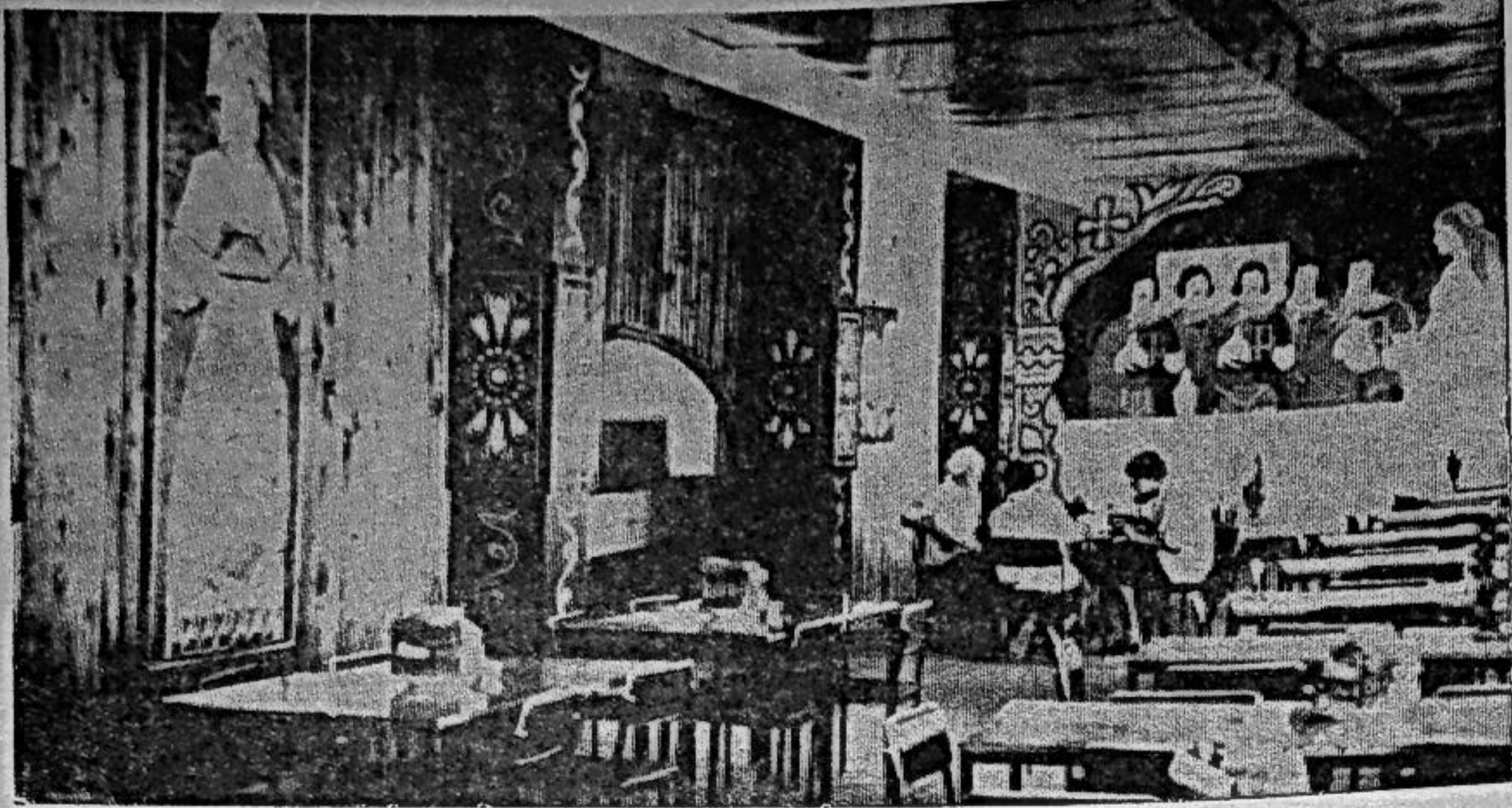
Интерьер столовой «Карловчанка», выполненный художниками УКБХ.