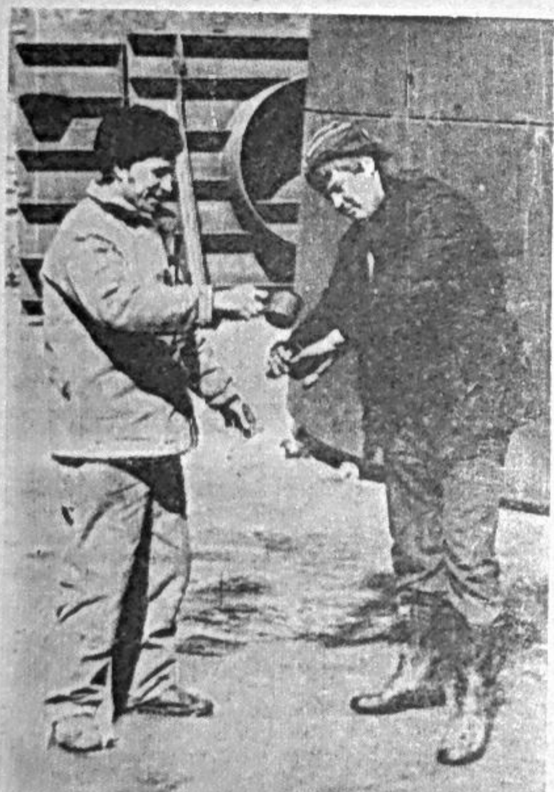
КОНЕЦ РАБОЧЕГО ДНЯ.