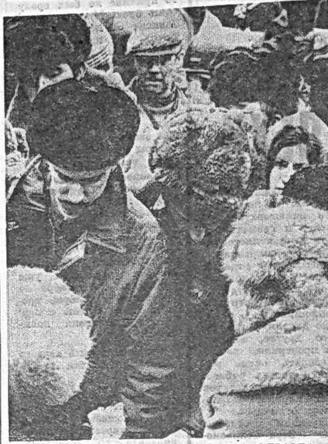
С книжного базара.