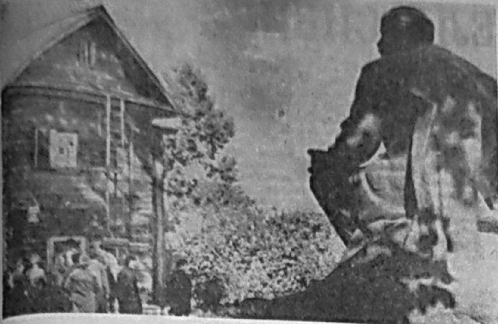
По ленинским местам Сибири