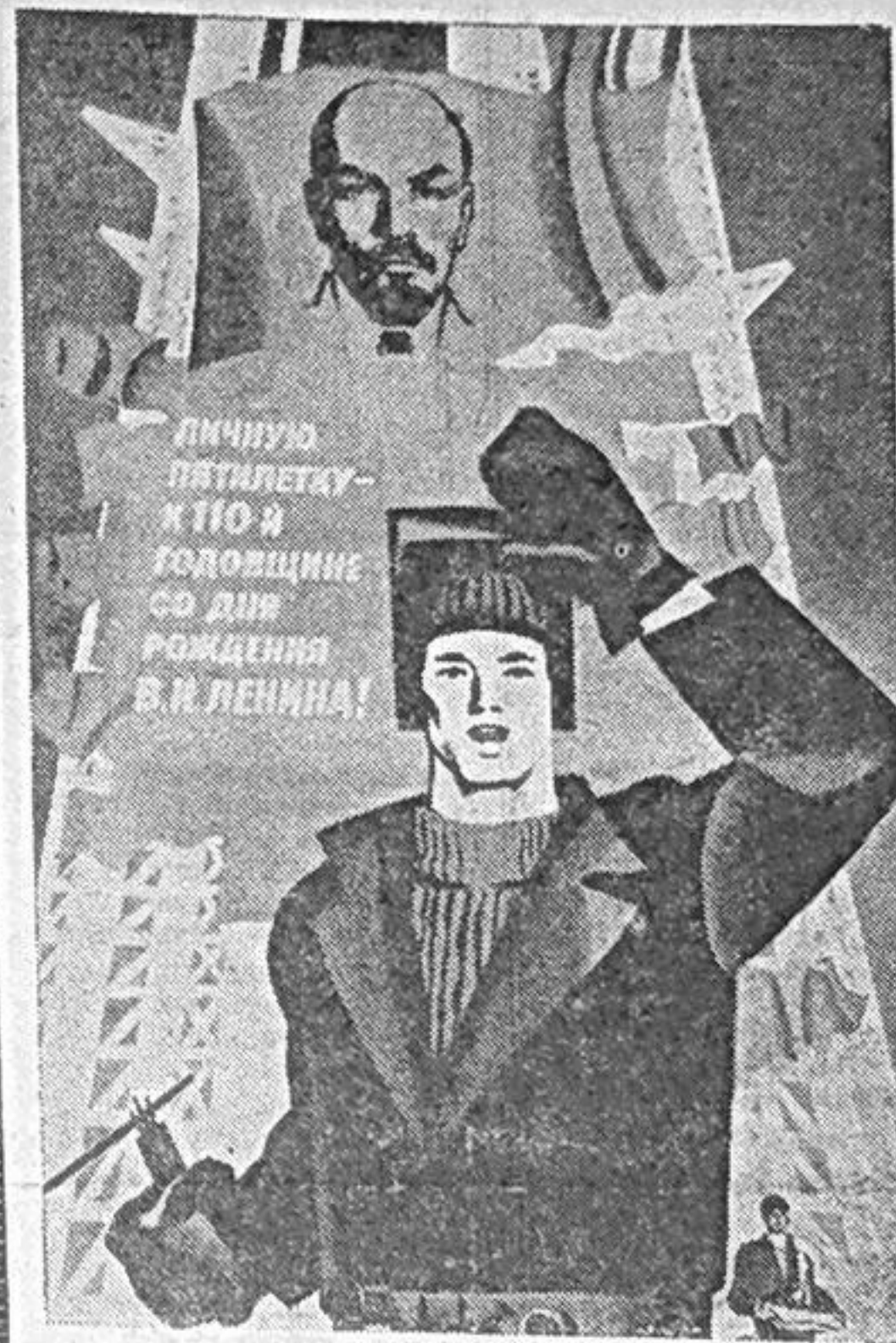
Издательство «Плакат».