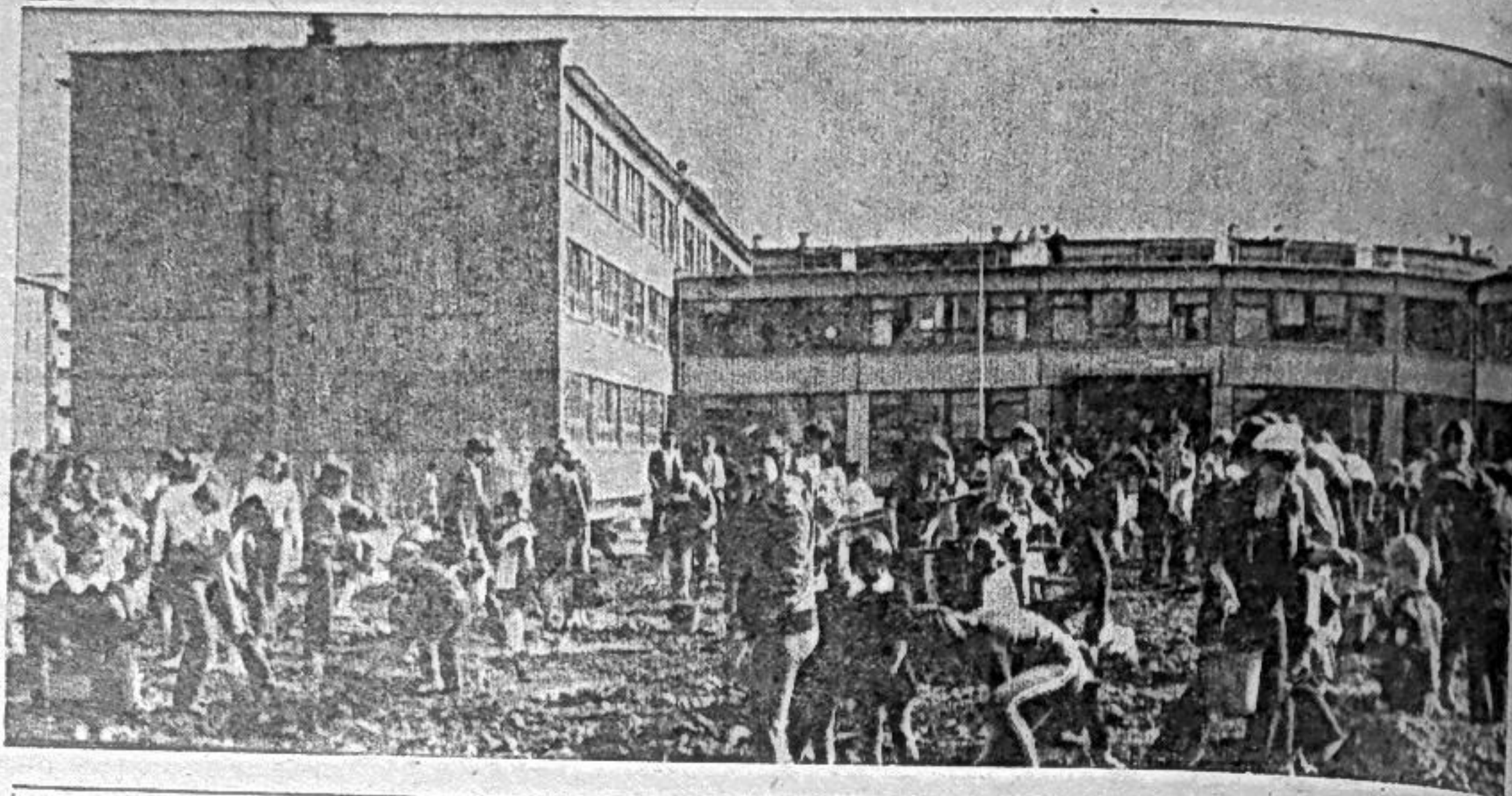
В СИСТЕМЕ ПОЛИТПРОСВЕЩЕНИЯ: ИЗ ОПЫТА РАБОТЫ ТЕОРЕТИЧЕСКОГО СЕМИНАРА САЯНОГОРСКОЙ СРЕДНЕЙ ШКОЛЫ № 2.

На итоговом занятии — научно-практической конференции на тему «В. И. Ленин, КПСС о воспитании подрастающего поколения» — были подняты актуальные проблемы воспитания, подведены своеобразные итоги учебно-воспитательной работы в школе.